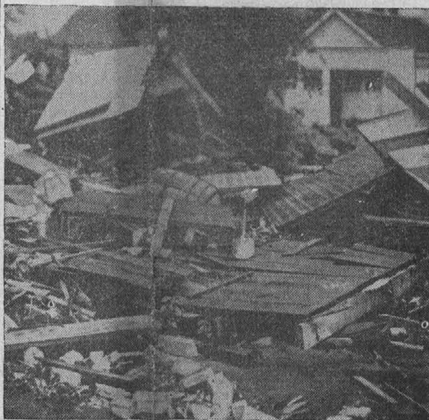
Na sliki vidimo opustošenje, ki ga je povzročil vihar v Anoki, Minn., kjer je bilo deset ljudi ubitih, nad 60 pa ranjenih, dočim znaša materialna škoda v okrajih, kjer je divjal vihar, nad $500.000.