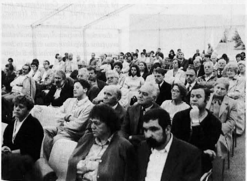
Udeleženci na nedeljskem predavanju

Draga '93 je torej za nami. Kljub nemilostnemu vremenu se je v tem tridnevju pod velikim Draginim šotorom zbralo veliko število obiskovalcev, ki so izpričali svojo navezanost na te študijske dneve.