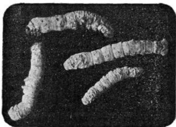
Pod. 1. Sušične sviloprejke po četrtem spanju.

Vzroka tej bolezni se še ne pozna. Ako preiščemo kapljico soka sušične sviloprejke pod mikroskopom, zapazimo v njem neštevilno zelo majhnih mehurcev, držočih se navadno dva in dva skupaj, ki niso nič drugega nego zelo majhne in drobne stvarce. Teh stvaric pa ni smatrati provzročiteljem te bolezni.