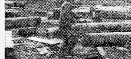
Les - stebel obnove - odhaja iz Kočevskega po vsej domovini