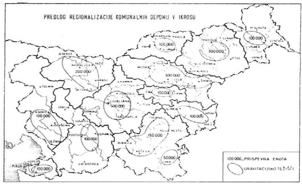
Na skici je predlog regionalnih deponij komunalnih odpadkov, ki jih predvideva Ikros. Pri tem ne gre za regionalizacijo v smislu dejanskih regijskih oziroma občinskih meja, ampak za zaokrožitve posameznih območij glede na število prebivalcev in glede na nekatero geografsko danosti in omejitve...