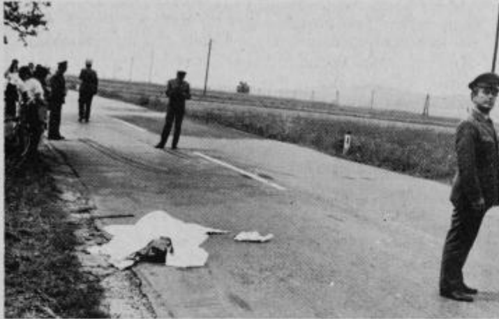
Kraj prometne nesreče. Miličniki morajo opraviti ogled in zagotoviti nemoteno odvijanje prometa.

Med prijavljenimi kršitelji prometnih predpisov je bilo 59 avtomobilistov, 123 mopedistov, 46 traktoristov, 3 kolesarji in 3 ostali kršitelji. Navedene številke so v primerjavi s številom posameznih prometnih