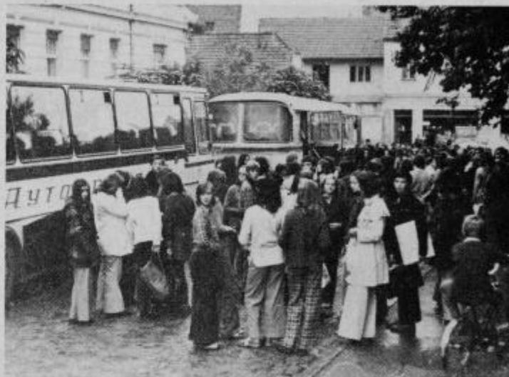
V petek zjutraj pred odhodom otrok iz Vrnjačke Banje. Mešana družba se poslovlja.