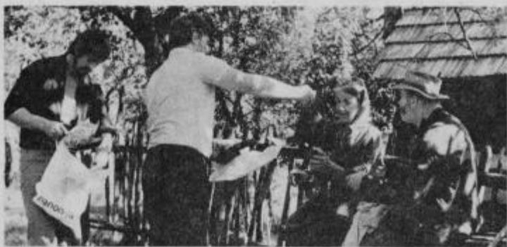
Stara zgubana obraza sta bila za trenutek spot srečna, kot včasih. Tople nogavice, toplo perilo. Zares dobri ljudje.