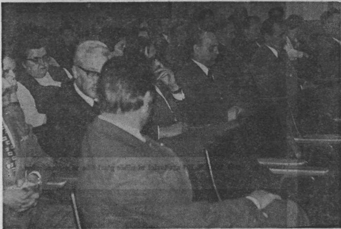
Iz konference na Starem Vodmatu