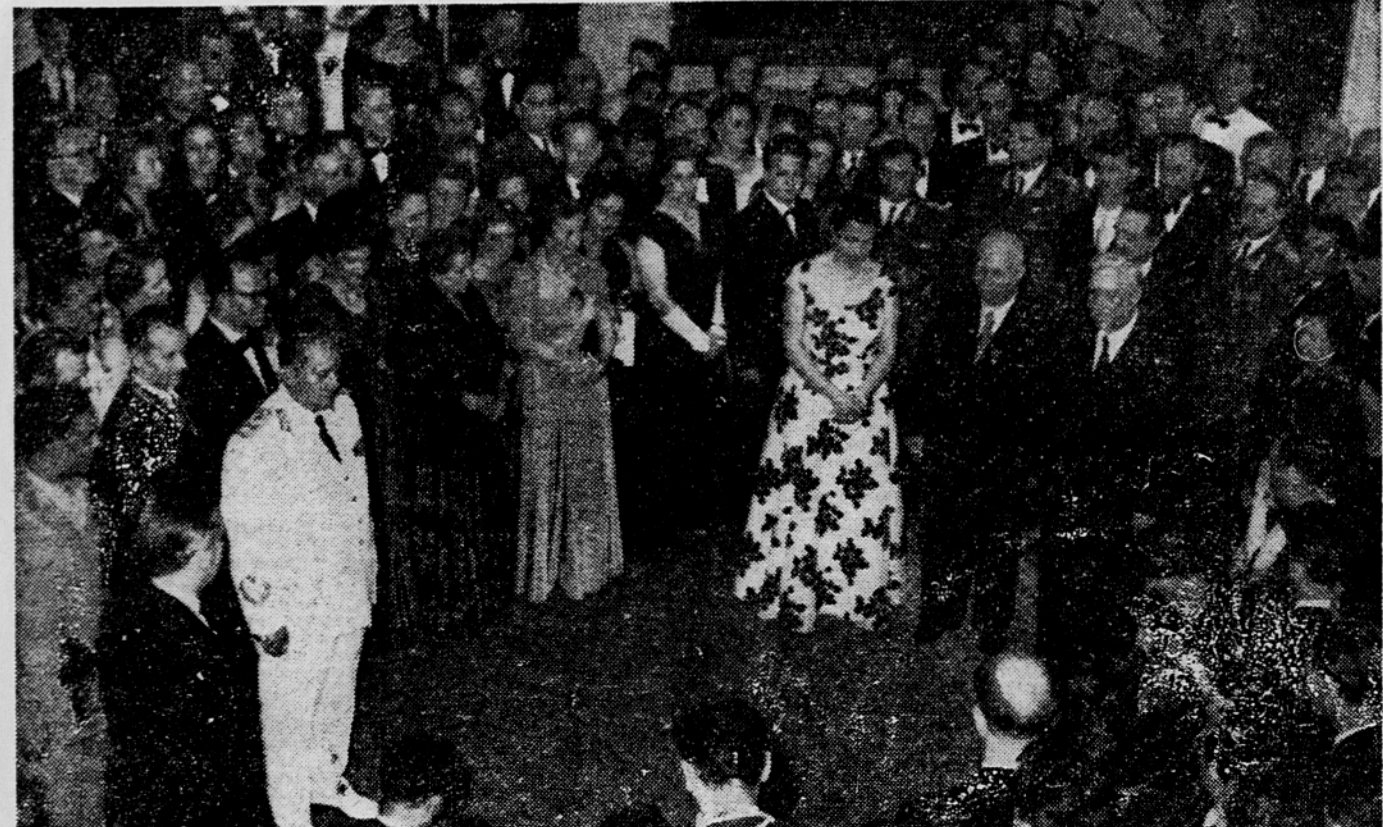
Na sprejemu, ki ga je predsednik Tito priredil 28. maja na čast sovjetski delegaciji: spredaj so videti številni domači in tuji novinarji, fotoreporterji in filmski snemalci, ki poročajo vsemu svetu o pomembnem dogodku.