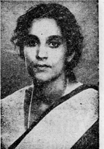
PARVATI KRISNANA je poslanka iz Madrasa. Univerzo je končala v Oxfordu. Je aktivna sindikalna delavica in funkcionarica v raznih sindikalnih zvezah. Bila je tudi tajnica združenja vseindijske federacije študentov.

V delegaciji je 12 uglednih članov indijskega parlamenta. Med njimi je 9 članov kongresa, 2 člana komunistične partije in 1 poslanec Akali stranke (stranke nacionalistov plemena Sikov).