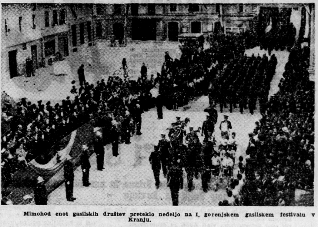
Mimohod enot gasilskih društev preteklo nedeljo na I. gorenskem gasilskem festivalu v Kranju.