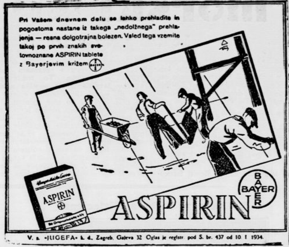
Pri vašem dnevnem delu se lahko prehladite in pogostoma nastane iz takega „nedolžnega“ prehlada resna dolgotrajna bolezen. Vsalet tega vzemite takoj po prvih znakih svetovnoznane ASPIRIN tablete z Bayerjevimi križem.