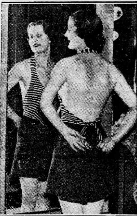
Model kopalne obleke za letošnje poletje