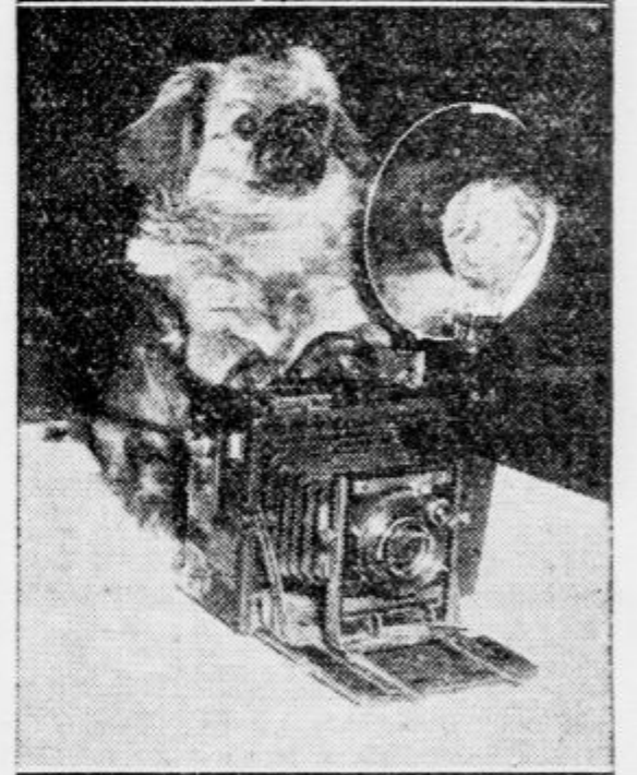
Kužek kot fotograf