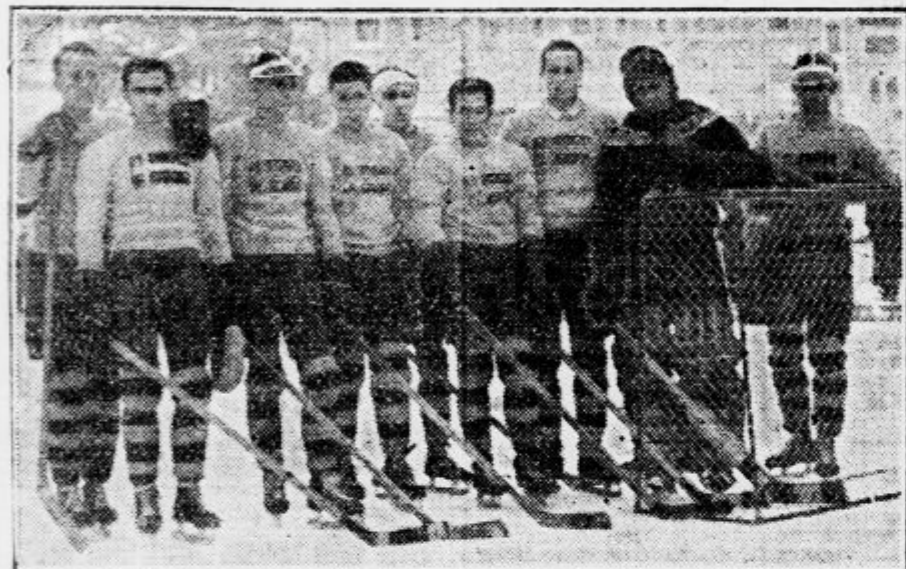
Hockey moštvo Wintersportkluba z Dunaja

Danes ob 15. na drsališču Ilirije ob Celovski cesti