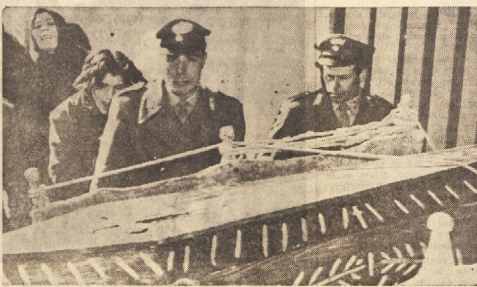
Taki prizori se na Siciliji ponavljajo že mnogo let

Seveda ni nikoli vodja mafije tisti, ki bi si umazal roke s kakršnim koli zločinom, temveč je naloga njegovih podrejenih, da opravijo zadevo tako, da ostane za vedno neresena. Vodje imajo vedno odlični alibi in tudi če ga nimajo, se ne našel vedno kot, ki bi dal zanje roko v ogenj. Lokalne policijske oblasti poznajo poimensko skoraj vse člane mafije in vendar jim ni uspelo skoraj nikoli dobiti v roke konkretnih podatkov o njihovi zločinski dejavnosti. In če se je kdo vendarle upal tako daleč, da je, ne samo obtožil člana mafije, temveč ga je pripeljal tudi pred sodišče, potem je pač moral računati s tem, da ga