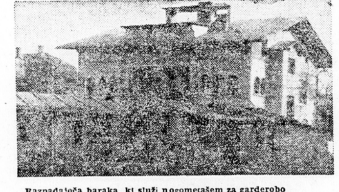
Razpadajoča baraka, ki služi nogometašem za garderobo

Smo v času, ko športna društva in klubi podajajo svoja poročila o uspehih in neuspehih v minuli sezoni, v naši državi, v kateri smo imeli v lani tako precejšen uspeh, kakor smo lanko zapisali mnogo dobrega in vzpodbudnega o nogometnem klubu Korotanu iz Kranja. Danes pa je slika močno drugačnaja, kar je pripeljal klub skoraj do katastrofe. Nohena tajnost ni, da je klub danes v precejšnji stagnaciji. Seveda so bili temu objektivni in subjektivni vzroki.