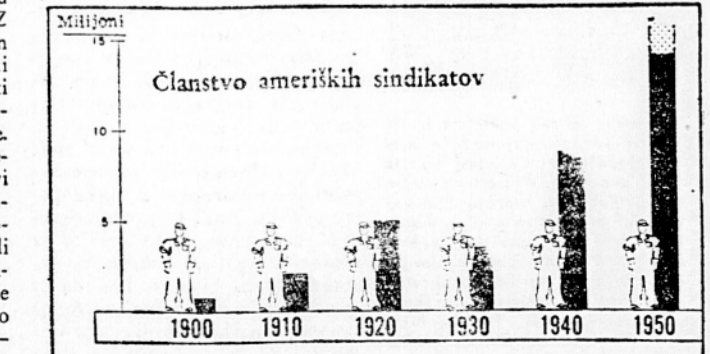
Članstvo ameriških sindikatov

Pogoji za takšno enotnost imajo svojo preteklost. Značilno je, da so se delavske stranke v ZDA pojavile prej kot v Franciji in Angliji. V začetku 19. stoletja so ameriški delavci dosegli takšne prednosti, zaradi katerih so jim močno zavidali njihovi evropski tovariši: v ZDA so delavci dobili volilno pravico že leta 1830, medtem ko so isto pravico dobili v Veliki Britaniji obrtniki šele l. 1867, poljedelci delavci pa l. 1885! Ameriški proletarijat in njihovi tedanji zavezniški socialisti-utopisti so izbojevali brezplačni pouk, deseturni delavci, odpravo zaporne kazni zaradi dolgov in še druge ugodne reforme.