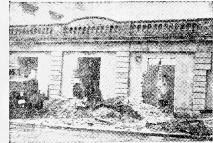
Kmalu bodo odstranjeni vsi spomeniki ljubljanske zaostalosti. Pred kratkim so pričeli podirati tudi bivši Bavarski dvor na Titovi cesti.

Občinski odbor Rdečega križa v Kresnicah skrbi, da v redu in uspešno poteka tečaj, na katerem se kmečka dekleta seznanjajo z zdravstveno prosveto. Na tečajih obravnavajo osebno higieno in higieno doma, z vzgojo in nego denarja, s preprečevanjem nalezljivih bolezni, prvo pomočjo itd. Tečaj redno obiskujejo tudi žene tovaršice, ki niso obvezne obiskovati tečaj.