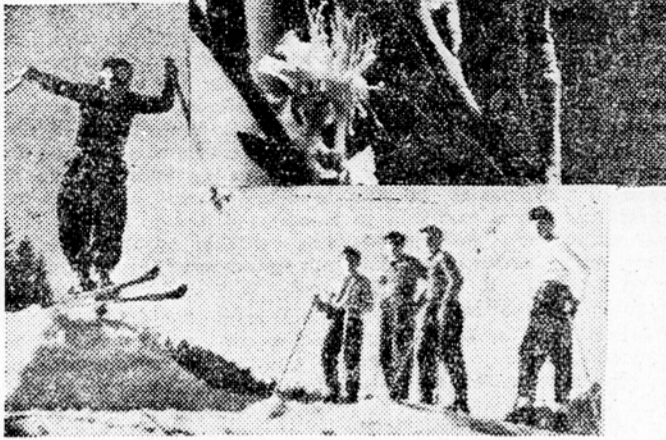
Medtem ko se pri nas zima že polno utevavlja, pa so nam delavci in uslužbeni, ki so na letnem dopustu na Crvenem otoku pri Rovinju poslali čvetočo slikovno velično, kot pozdrav bralcem in uredništvu »Slovesnega poročevalca«