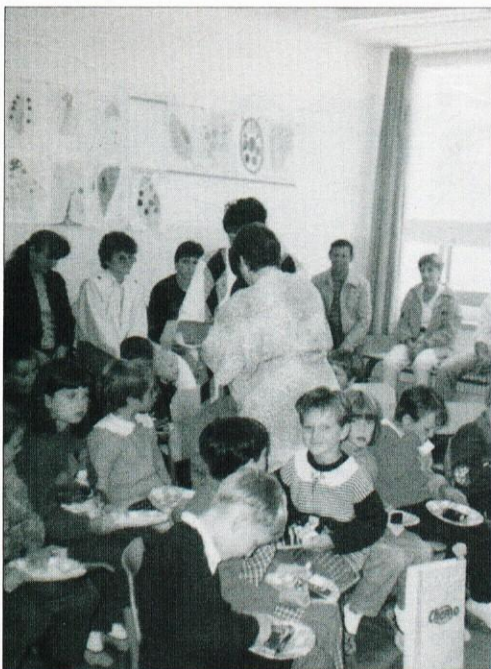
Prav toliko let imamo, kot naša država, pravijo prvošolčki iz Rovt.