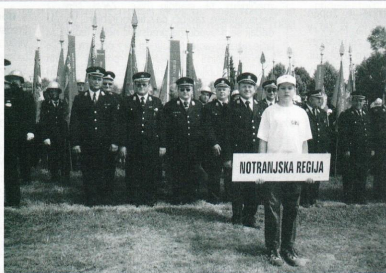
Tudi Logatčani so bili minulo nedeljo med več kot tri tisoč udeleženci slovesnosti ob 130-letnici gasilstva v Sloveniji in Metliki. Obenem je Gasilska zveza Slovenije proslavila svojo 50-letnico, Gasilski muzej v Metliki pa 30-letnico.