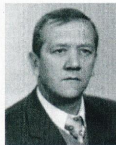
Ob izgubi dragega moža