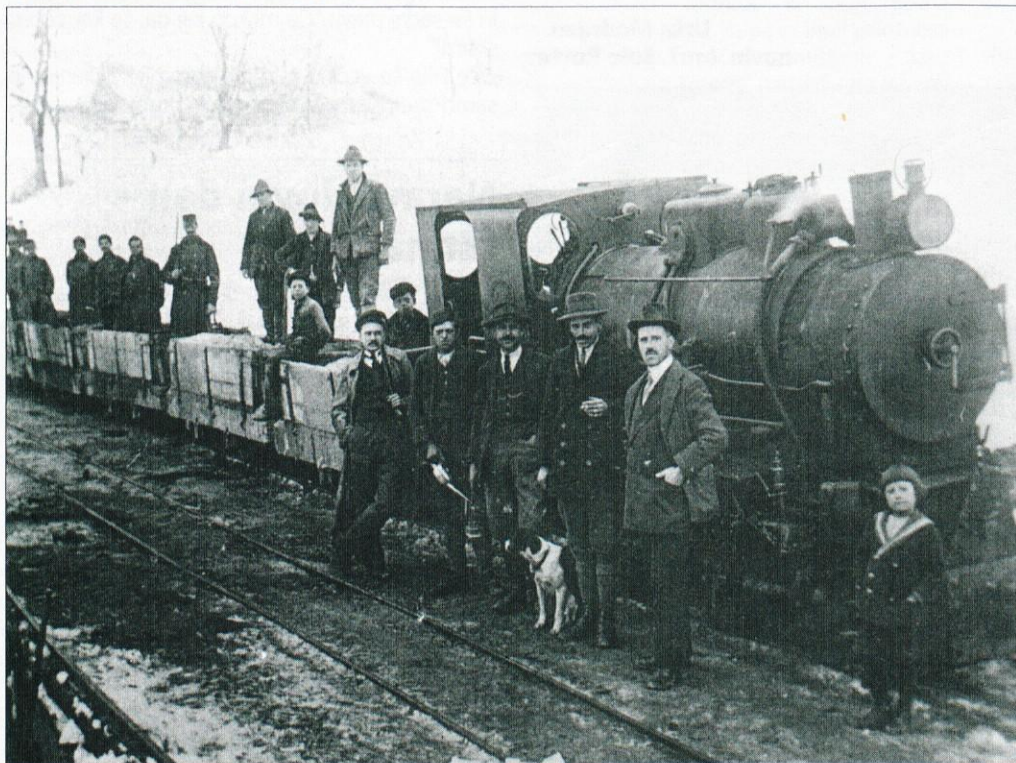
Fotografija iz leta 1917: možje pred lokomotivo in na transportnih vagonih ozkotirne železnice Logatec - Črni vrh.

S preučevanjem arhivskega gradiva (nekaj izjemno dragocenega je šoli podaril inž. Karol Rustja), z delom na terenu in prek ustnega izročila se pred nami odpirajo knjižne strani, ki govorijo o Logatcu ob južni železnici, o vodni postaji (pumpenhaus) - zanimivi tehnični dediščini, o tunelu pod Naklom, ki naravnost kliče po ustreznih osmislitvi, o gradnji železnice iz Logatca proti Črnemu Vrhu za potrebe soške fronte v prvi svetovni vojni in še o čem.