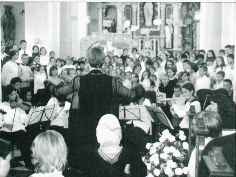
Združeni cerkveni pevski podmladek med zaključnim nastopom