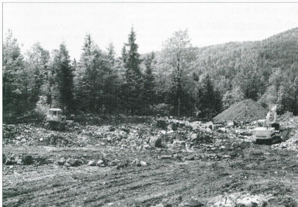
Težki stroji spreminjajo vrtačasti kraški svet v ravnico.