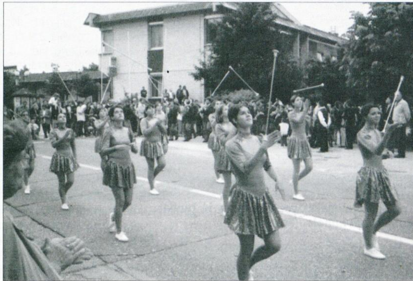
Logaški pihalni orkester je sredi junija uspešno pripravil in izvedel 5. srečanje godb. Na fotografiji mimohod z logaškimi mažoretkami v ospredju.