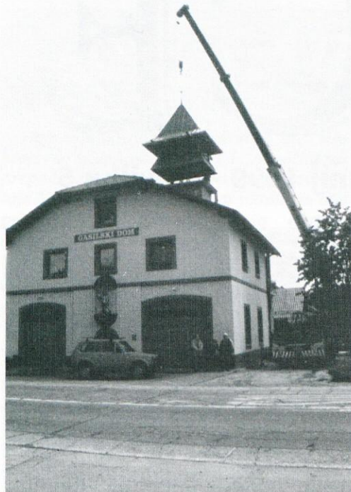
Tudi gornjelogaški gasilski stolp je junija dobil svojo kupolo.