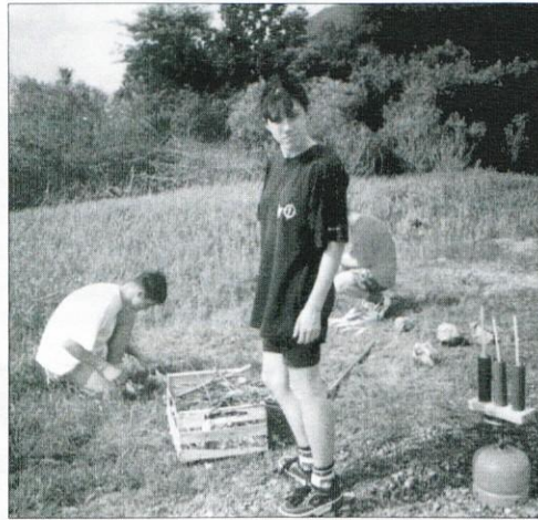
Fizikalna skupina je ob reki Unici izvajala različne poizkuse.

Po mnenju Urada za informiranje Vlade Republike Slovenije št. 4/3-12-1622/95-23/346 šteje glasilo med proizvode informativnega značaja iz 13. točke tar. št. 3 Tarife prometnega davka, po kateri se plačuje 5% davek od prometa proizvodov.