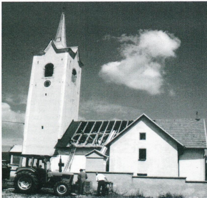
Prizadevni Medvejci so uredili pokopališče in na novo prekrili podružnično cerkev sv.Katarine. Na fotografiji prekrivanje strehe.