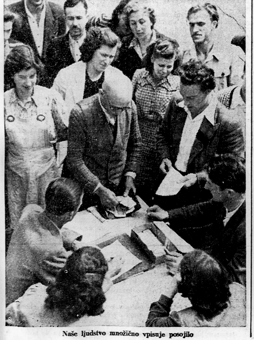
Naše ljudstvo množično vpisuje posojilo

danja? Če ne bi nič vedeli, bi bilo to bolj opravičljivo. Med našima partijama in našima državama so se razvili bratški in pristranski odnosi. Plenum BRP(k) pravi v svojem sklepu, da enodusno odobrava resolucijo posvetovanja Informbiroja in delo bolgarske delegacije na posvetovanju. Sklep nalaga Politbiuroju »naj takoj organizira pojasnjevalno delo v Partiji in med ljudstvom v zvezi z resolucijo Informbiroja, da se sklicuje sestanki partijskega aktiva v vseh okrajnih centrih z referenti CK, pozneje pa tudi sestanki vseh nižjih partijskih organizacij, ki bodo na ta način lahko uporabljale izrpen referat Trajca Kostova in da se mora to »pojasnjevalno« delo izvesti tudi po liniji Nacionalnega sveta po organizacijah Domovinske fronte.« Tako pospešeno »pojasnjevalno delo« nima objektivno nobenega drugega namena kot da bi v očeh bolgarskih komunistov in bolgarskega ljudstva blaflo ugled, ki ga uživajo naša Partija ter naše partijsko in državno vodstvo v bratški Bolgariji, ne da bi imeli kakšno možnost do obrambe. Sklep o takem delu krani na koncu komitikeja globoko prepričanje, »da se bo našlo v KPJ in med narodi bratske Jugoslavije dovolj sil, zvestih osnovam marksizma-leninizma, da bi obvladale nacionalistične, antimarksistične in antisovjetske odklone in ozdravile jugoslovansko vodstvo, ki ne bodo dovolile nobene odcepitve Jugoslavije od enotne protimperialistične fronte, Sovjetske zveze, držav ljudske demokracije in demokratičnih gibanj na svetu, temveč bodo še bolj