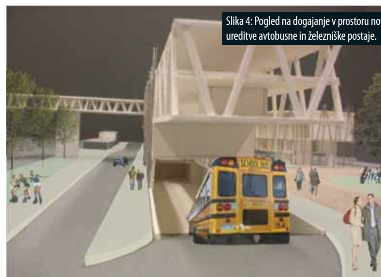
Slika 4: Pogled na dogajanje v prostoru nove ureditve avtobusne in železniške postaje.

The old town centre of Sevnica represents a dominant element, the pivot of the town, important for both the town inhabitants and its visitors. The old city centre with its skyline's dominant feature, Sevnica Castle, is an important connection point with the heritage of the area. In the future, this physical and perception centre will represent a 'focal point' in the town; however, the centre must not become the place to relieve the town's traffic issues. The rural counterbalance represents the town of Boštanj with its spatial dominant element – the church and the square.