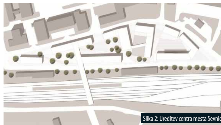
Slika 2: Ureditev centra mesta Sevnica.