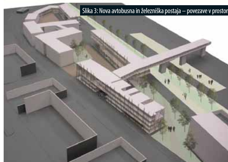
Slika 3: Nova avtobusna in železniška postaja – povezave v prostoru.