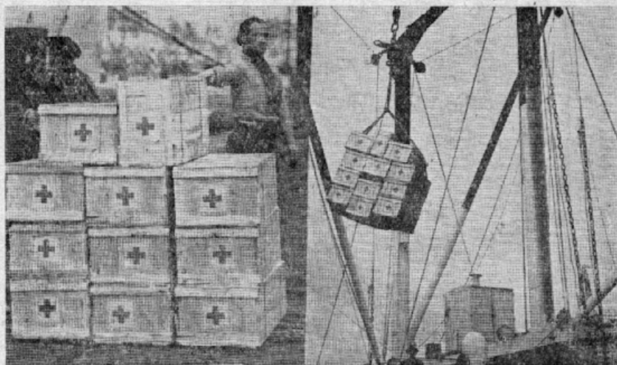
Zaboje vkrcavajo na ladjo, katera je te dni odrinila proti Evropi

Skoro v vsaki številki "Slovenskega lista" pozivljamo rojake, da po svojih močeh skušajo lajšati bedo teh naših nesrečnežev, ki so padli v nesrečo ne po svoji krivdi, ampak za čast in v obrambi domovine, za obstoj slovenskega naroda in vsega slovanstva. Toda če pregledamo izkaz onih, ki so kaj darovali zanje, bomo našli v njem prav malo roj-