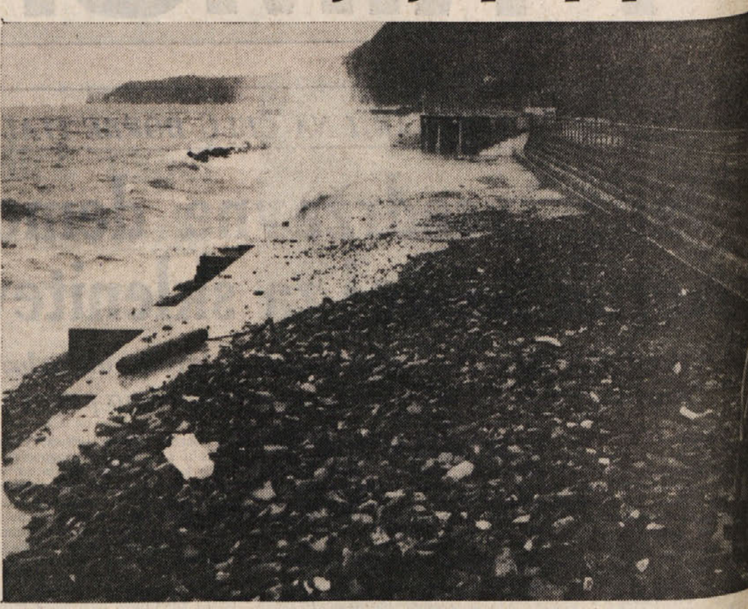
Valovi so prekrili nabrežje v Barkovljah s kamenjem