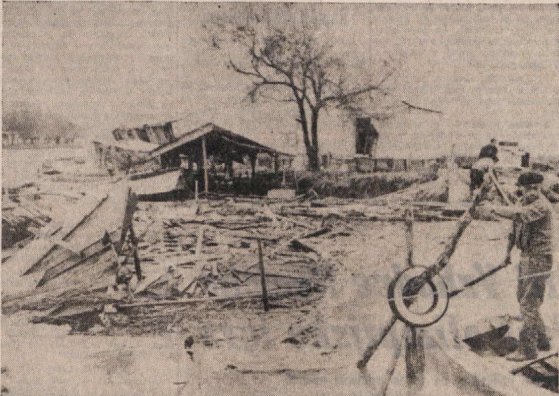
Morski valovi so porušili nad 40 ribiških barak vzdolž morske obale pri Tržiču. Ker so predstavljale to kategorijo pomembno premoženje (v barakah je bila tudi ribiška oprema), pomeni njihovo uničenje hud udarec za številne družine

Razgovor z ministrom o ronškem letališču