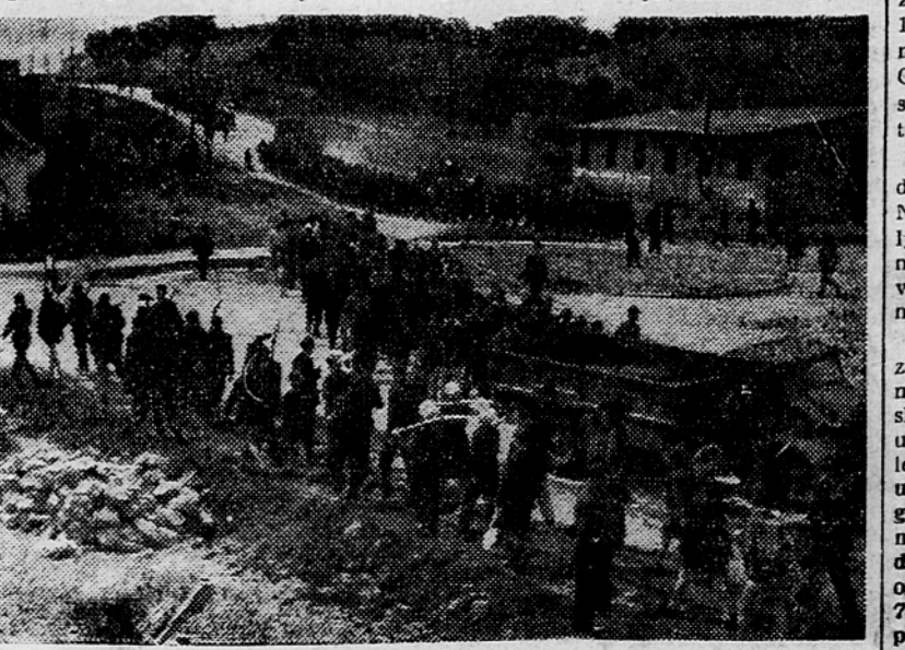
S pesmijo odhajajo brigade na delo