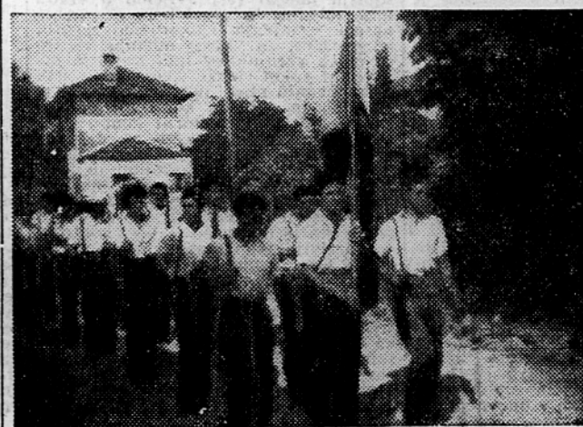
Na pot je odšla prva patrolja goriške smeri partizanskega pohoda

Ker terja izdelava kompleksiranih strojev visoko kvaliteto delo, je delavski svet tega podjetja pred dvema mesecema sklenil, da se vrnejo z raznih administrativnih in nadzornih mest v proizvodnjo vsi kvalificirani mojstri. Po njihovi vrnitvi se je v livarni hitro dvignila kakovost izdelkov, kar se kaže v znatnem zmanjšanju izmečkov.