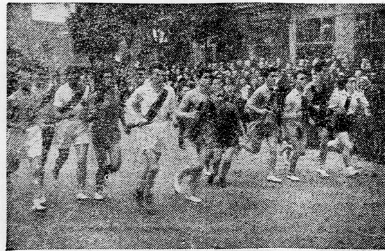
Nosilci štafetnih palic na Terazijah v Beogradu

Naša država koraka zelo naglo v boljšo in srečnejšo bodočnost. Razumljivo je, da imamo na tej poti ve-