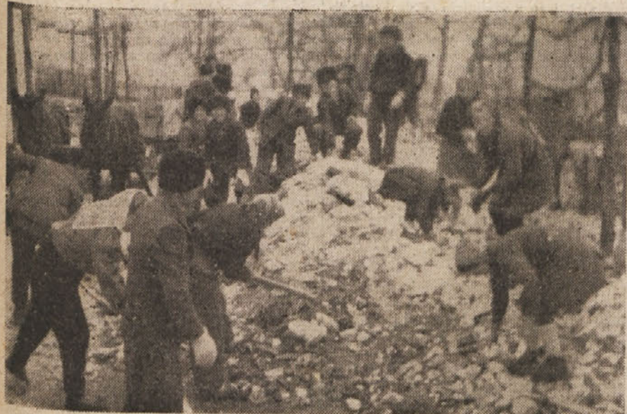
Tudi oni hočejo tekmovanje zaključiti z »Dnevom dela«. — V Zatočminu so bili vsi pionirji na delu

To je naše izpričevalo, vsakomur ga lahko pokažemo, in to s ponosom, posebno onim, ki jim naše delo ni všeč; nalahčje nočemo reči »zaslepljenec«, ker težko verjamemo, da bi se jim oči pri naših delih še ne odprle in ne bi spre-gledali. Pošteno delovno ljudstvo se ra-