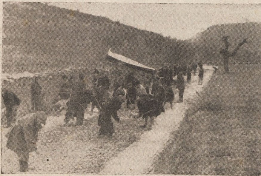
Na cesti Dekani—Sv. Anton

Zgradili smo več napajališč v skupni meri 1932 kub. metrov. Marsikje so bile postavljene nove delavnice, 11 popolnoma novih in 5 delno obnovljenih; 5 novih žag in 2 delno obnovljeni; 1 pekarna na novo sezidana, 1 delno obnovljena; 4 zidane nove apnenice, 89 košarastih, 408 apnenih jam. Kot velik uspeh beležimo