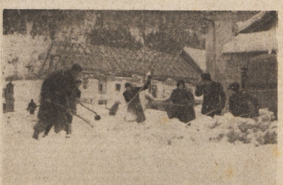
V Črnem vrhu zaključujejo tekmovanje. Ne ovira jih burja in hud mraz —8 stop. Celzija, neumorno odstranjujejo izpod snega ruševine