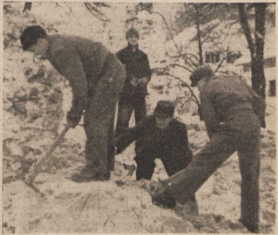
V snegu in mrazu se udarniki odzivajo Titovemu pozivu

Nato si slede: okraj Vipava 23,032.000 lir; okraj Idrija-Cerkno 14,946.000 lir; okraj Postojna 12,541.000 lir; okraj Ko-