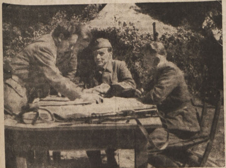
Štab IX. Korpusa

Borba primorskega ljudstva, borba IX. korpusa je rodila veliko in toliko zaželeno svobodo. Davne sanje so se izpolnjevale.