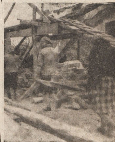
Šolo v Marezigah obnavljajo

Oglejmo si še, v kakšna dela so se združili silni milijoni, ki jih je prav s