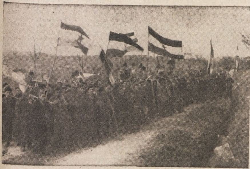
V Slovenski Istri zaključujejo z »Dnevom dela« Vaščani Kubeda in Sočerge so končali z delom

Obnovljenih 1363, v delu 268, skupno 1631 poslopij