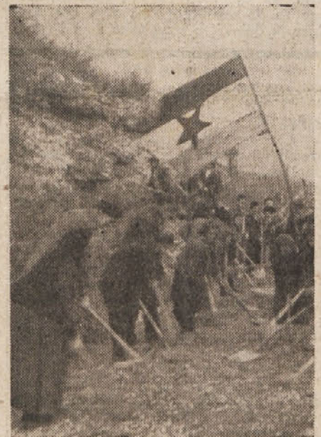
Na cesti Zadlaz—Ravne dela naša stara mati, ki hoče tudi pomagati

Primorsko ljudstvo je z lastno iznajdljivostjo pričelo reševati najbolj pereči problem in pokazalo se je, da je uspelo, in to v celoti. Z zadovoljstvom ugotavljamo, da je led prebil, da je kritični