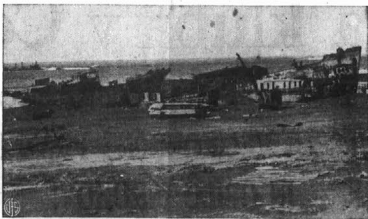
Otok Iwo Jima po treh letih. — Razbite in zapuščene leže na jugovzhodni obali otoka razne ladje in bojni čolni, ki so mrtev pričeli strašnih bojev, ki so se vršili na tem otoku 1945, predno so naše čete izrgale otok Japoncem. Tu so se vršili najbolj krvavi boji na Pacifiku.