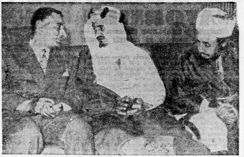
KAIRO, 8. febr. (AFP). Zunanji minister Saudske Arabije emir Fajsal je danes izjavil, da se bo Saudska Arabija umaknila iz arabskega pakta kolektivne varnosti, če bo iz njega izstopil tudi Egipt. Novemu paktu za arabsko kolektivno varnost se bo njegova država pridružila samo, če bo Egipt predložil ustanovitve takega pakta, je dejal minister in dodal: »Saudska Arabija in Egipt bosta vodila isto politiko.« Predsednik sirilske vlade pa je v Damasku izjavil novinarjem, da Sirija spoštuje obveznosti, ki jih predvideva ministrska deklaracija in ne bo sklepaala nobenih novih zvez izven arabskega pakta kolektivne varnosti in ustanove Istine Združenih narodov. To izjavo je dal Faris el Huri v odgovor na članek egiptovskega ministra za nacionalno orientacijo majorja Salaha Salema, ki je bil objavljen v popularnem egiptovskem listu »Al Gamhuriya« v zvezi s stalnim sirilsko delegacijo na arabski konferenci predsednikov vlad arabskih držav. (Na sliki: Egiptovski premijer Naser v razgovoru s saudskim zunanjim ministrom emirom Faisalom in njegovim jemenskim kolegom Saifom el Hassanom.)

Bonn, 8. febr. (AFP). Predsednik socialno demokratske stranke Erich Ollenhauer je danes odpotoval v London, kjer se bo udeležil razgovorov sekretariata socialistične internacionale. Pričakujejo, da bo morda navezal stike s predsednikom indijske vlade Nehrujem, ki je prišel v London na konferenco britanske skupnosti narodov.