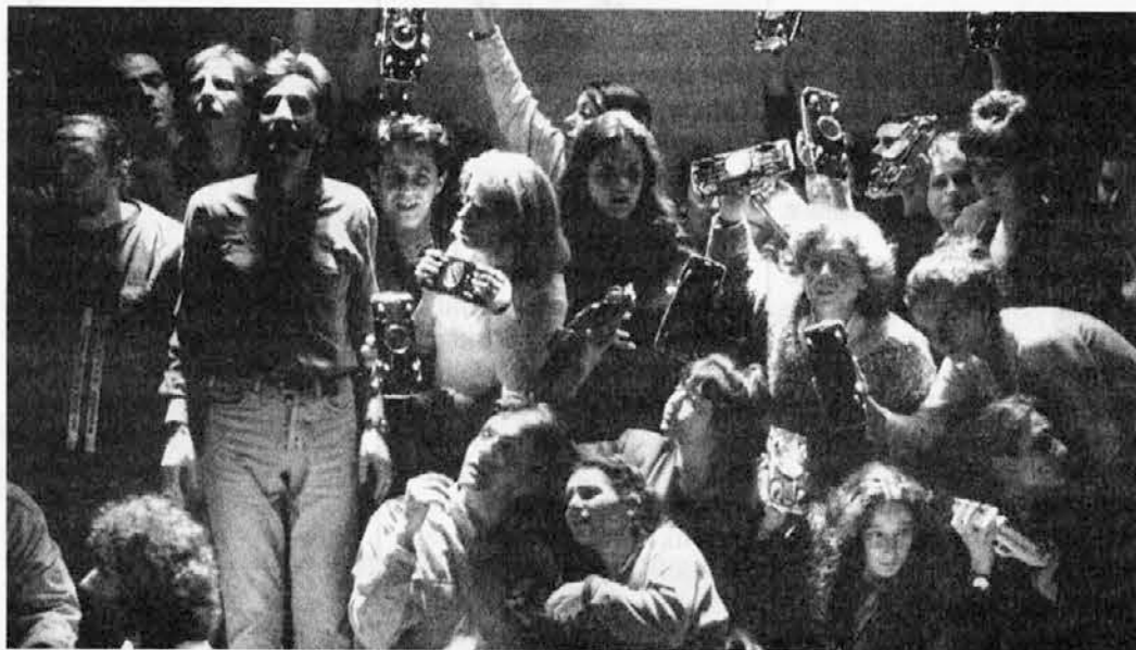
Un'immagine tratta dal "Canto per Torino" che ha ispirato "Il canto delle città"