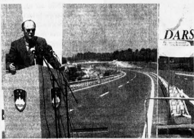
Il premier sloveno Janez Drnovšek ha presenziato venerdì mattina all'apertura del tratto autostradale che collegherà Nova Gorica con Lubiana

di guerra. Durante l'assemblea, presso il Cankarjev dom, i rappresentanti del sindacato dei docenti e dei ricercatori hanno messo a punto la protesta che dovrebbe scattare giovedì 6 giugno. Le richieste sindacali interessano in primo luogo l'aumento della mensilità che oggi varia dalle 600 alle 900 mila lire, mentre lo stipendio di un professore universitario a fine carriera non supera 1.700.000 lire.