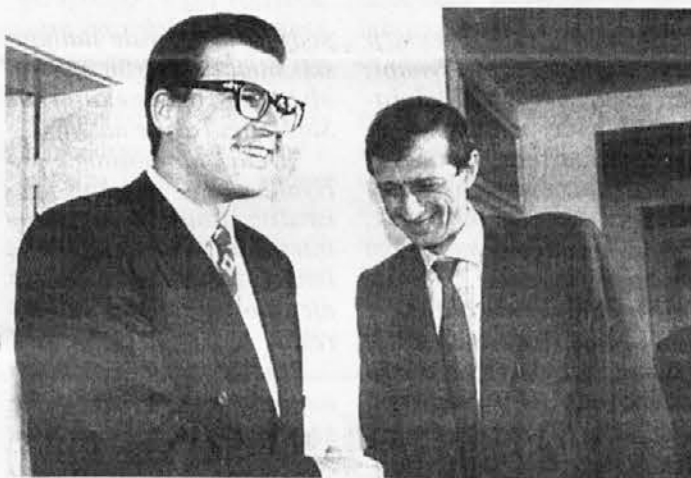
Thaler e Fassino durante l'incontro di lunedì a Lubiana

Entro la fine di giugno la Slovenia entrerà nell'Unione Europea. La firma dell'accordo di associazione sarà dunque posta nel semestre europeo guidato dall'Italia.