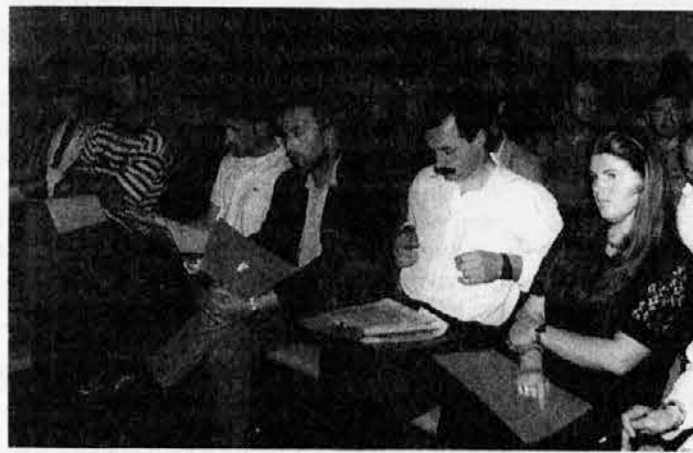
Delegati iz vseh treh pokrajin na kongresu Zskd