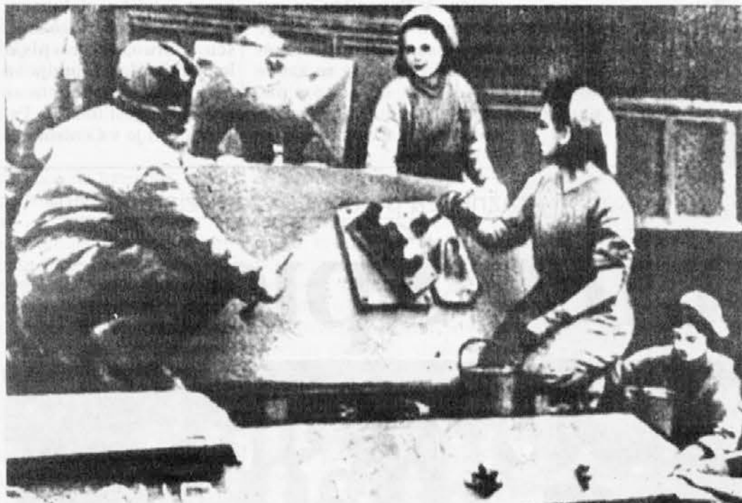
Operaie inglesi dipingono scritte su un carro armato destinato all'Unione Sovietica nel quadro della collaborazione della coalizione antifascista

Negli stessi giorni in cui a Detroit si riuniva il congresso delle nazioni slave nel mondo, il 4 e 5 aprile a Mosca ci fu una nuova riunione panslava. Parlò lo scrittore Nikolaj Tichonov e si ricordò il sangue slavo versato nella guerra contro il comune oppressore, mentre il compositore Dmitrij Sostakovič, un interprete