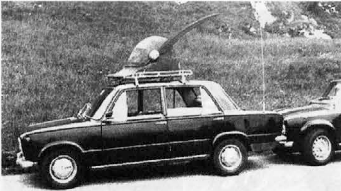
Solarje 1977