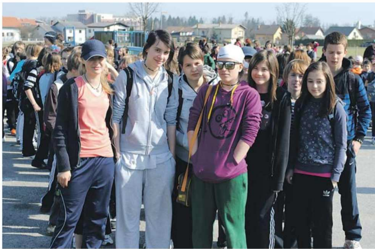
Pohoda, ki so ga pripravili po obnovljeni trimski stezi, so se udeležili tudi šolarji radenske osnovne šole.