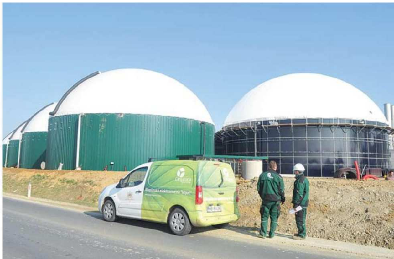
Bioplinarna v Vučji vasi je pred začetkom obratovanja. Bo dovolj biomase za njeno normalno delovanje?

Pri nas so ponovno aktualne primerjave z Avstrijci. V teh primerjavah pa se zanemarja, da avstrijska kmetijska politika teži k čim višji samooskrbi. Temu primerno se tudi obnaša do tuje hrane. Za Avstrijo je značilno, da je vsak tuj trgovec z živili, ki stopi na avstrijski trg, obsojen na propad, če na svojih policah ne ponuja domače avstrijske hrane. Nedoslednosti kmetijskih politik pri nas in na Madžarskem pa spretno izkoriščata za nakup manjkajočih surovin, med drugim tudi biomase za potrebe svojih bioplinarn.