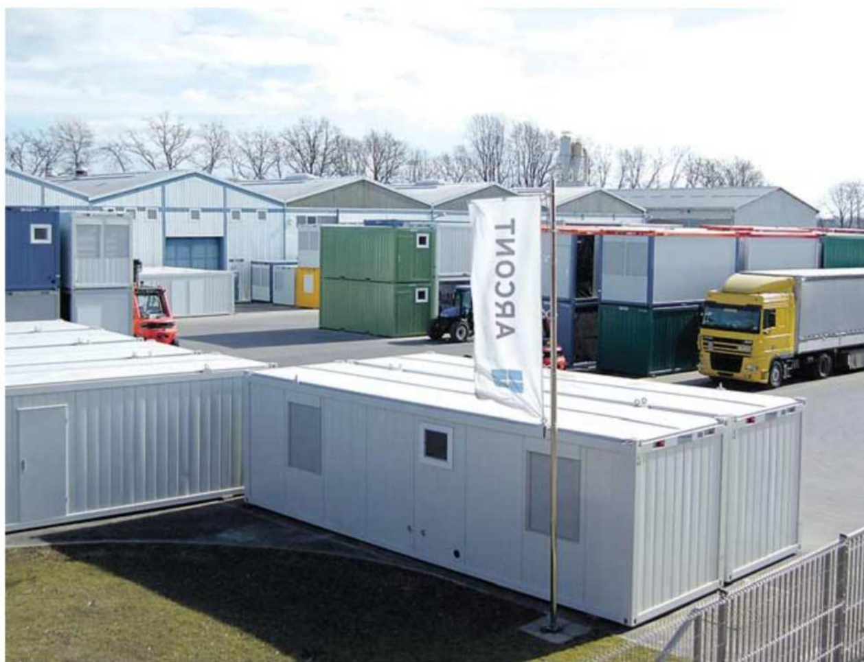
Arcont je dobil sredstva iz drugega razpisa, ki so mu pomagala k tehnološki posodobitvi in razvojnemu preboju.

Podatek, ki vpliva optimizem, hkrati pa je zavajajoč, je nadpovprečna rast izvoza, ki naj bi v letošnjem letu dosegla dobrih devet odstotkov. Ob tej rasti, pravi