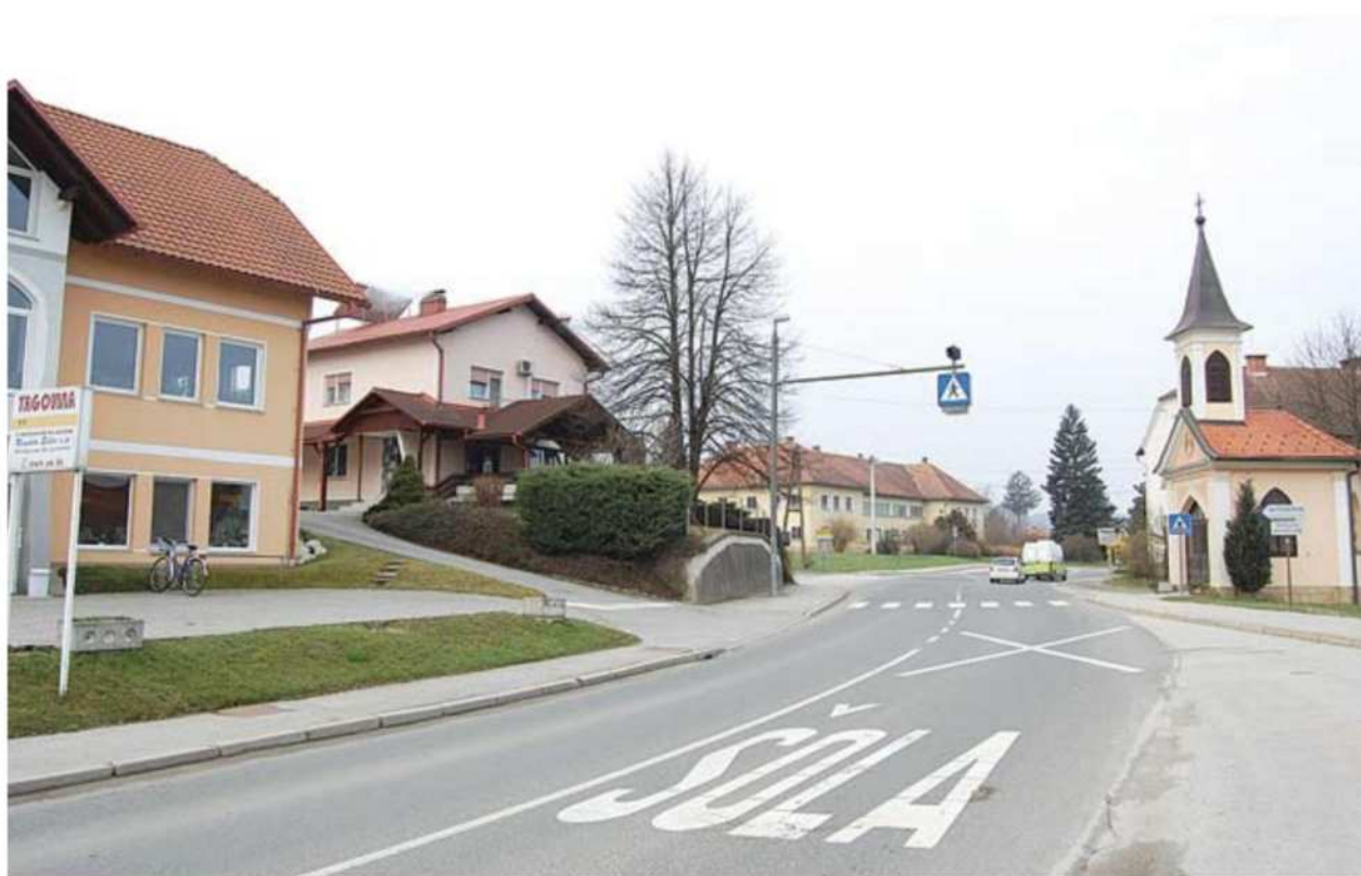
Plačan samoprispevek bodo prebivalcem Stročje vasi upoštevali. Občina pripravlja predlog rešitve skupaj s predstavniki krajevne skupnosti.

Ko so leta 1994 skozi Stročjo vas obnavljali regionalno cesto, so s takratne Skupščine občine Ljutomer vodstvu Krajevne skupnosti Stročja vas predlagali, da bi ob cesti naredili tudi pločnik. Ker so bili takrat že narejeni projekti za kanalizacijo, so se tudi strinjali, da bi bilo dobro, če bi pod pločnik položili še glavni vod kanalizacije, da ne bi imeli kasneje dodatnih del in še večjih stroškov. Ker pa ni bilo denarja za kanalizacijo, so predlagali, da krajani plačujejo samoprispevek. Zdajšnji predsednik Krajevne sku-