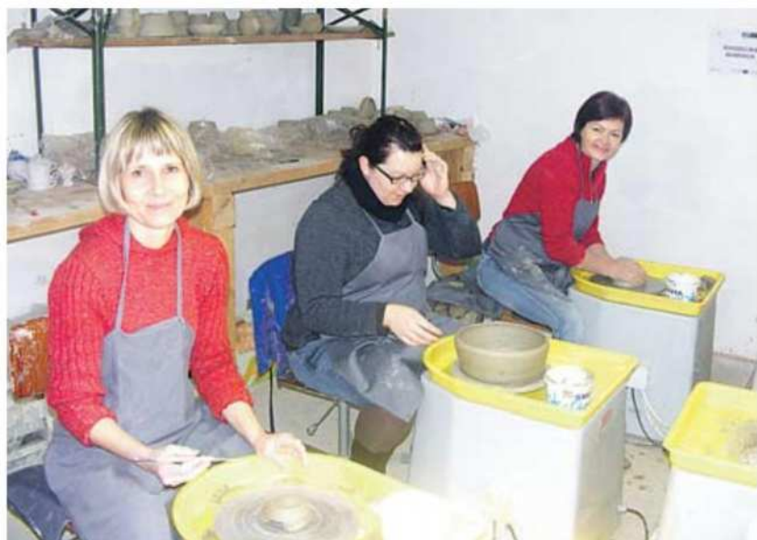
V Centru Duo Veržej so v zadnjih letih organizirali vrsto delavnic domače obrti.

zgradbi je dvesto tisoč evrov, izvajalec del pa je PGP Ljutomer. Dela naj bi končali maja.