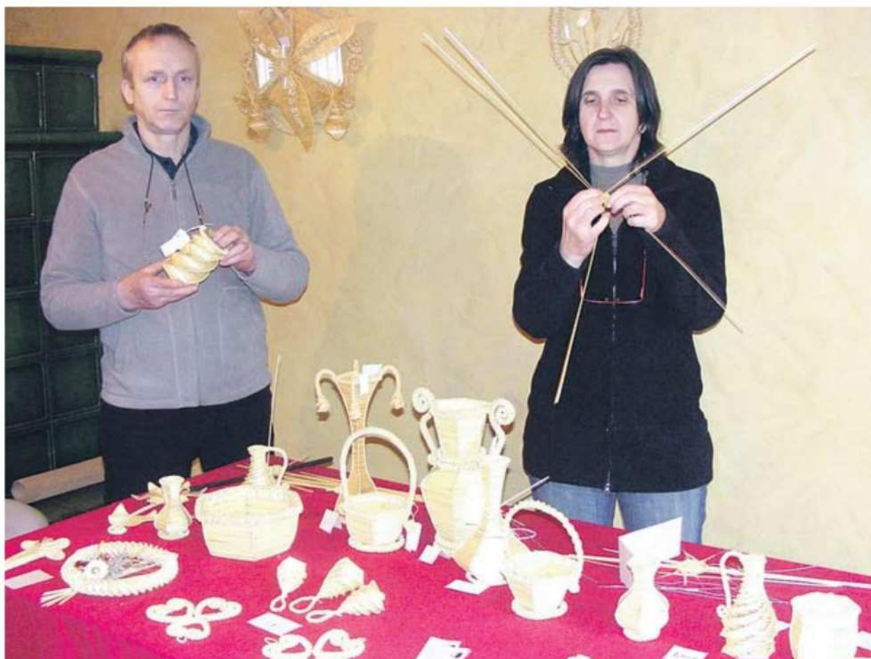
Pri Jakobovih, kjer je tudi razstavná galerija izdelkov iz slame, pogosto gostijo organizirane skupine turistov, šolarjev in drugih.