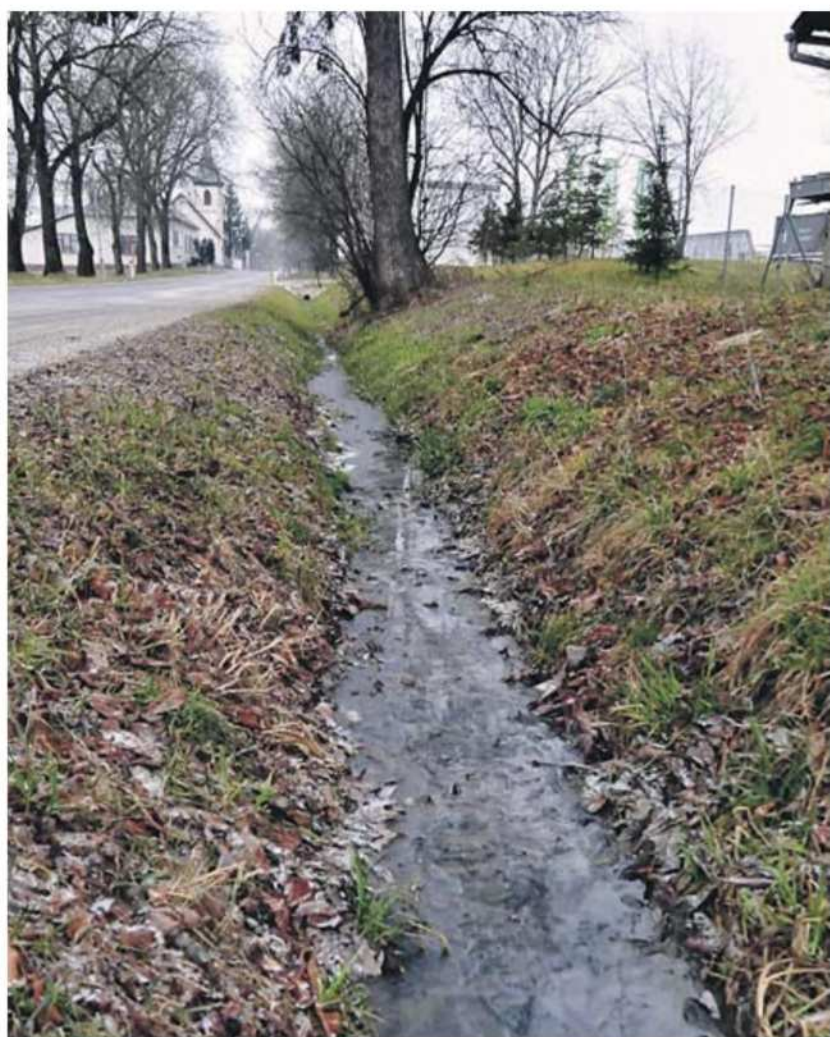
Nenavadna oblika in vonj sedimentov v obcestnem jarku in potoku v Motvarjevcih sta pritegnila pozornost občanov in naravovarstvenikov.

Pred kratkim smo v uredništvo Vestnika prejeli fotografije občana Moravskih Toplic (na njegovo željo imena nismo objavili), ki kažejo na klavno podobo obcestnega jarka v Motvarjevcih in Kobiljanskega potoka, ki teče le nekaj me-