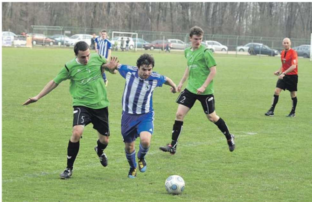
S tekme v Veržuju