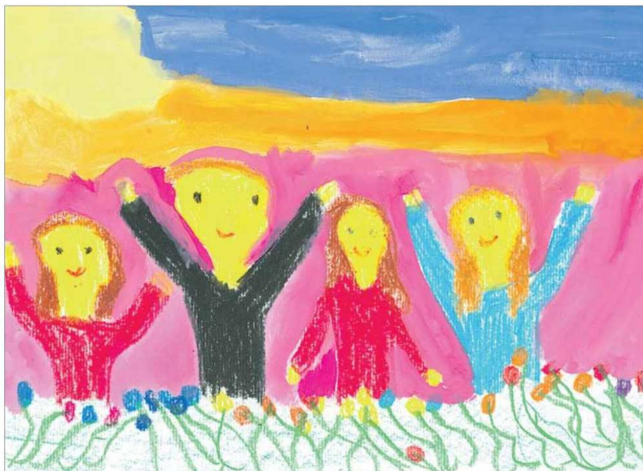
Moja družina, Metka Režonja, Osnovna šola Turnišče