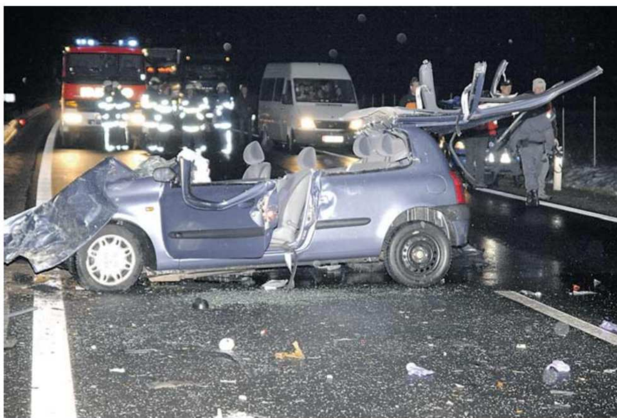
Raziskava je pokazala, da se Pomurci najbolj bojijo biti žrtev prometne nesreče, tatvine ali vloma, bistveno manj pa, da bi bili žrtev fizičnega nasilja ali vandalizma.