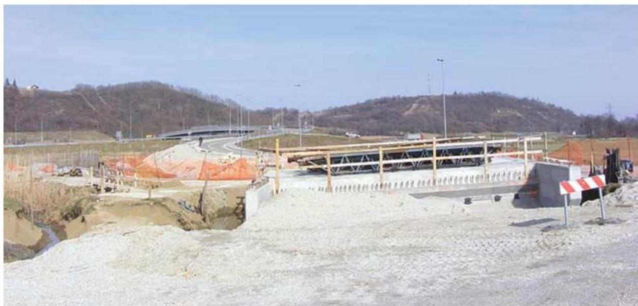
Betonska konstrukcija mostu je narejena, vendar gradnje ne nadaljujejo.