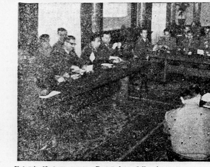
V torek, 10. t. m. so se v Beogradu začeli tristranski vojaški razgovori med predstavniki generalnih štabov Grčije, Turčije in Jugoslavije

Jugoslavija tvori zahodni konec južnega obrambnega zidu proti ruskemu imperializmu v Vzhodni Evropi. Grčija in Turčija dopolnjujeta polkrog, ki je ena izmed najboljših trdnih obrambnih utrd. zgrajenih po letu 1945 in najbolj uspeh Churchillovih po-vojnih zasnov. Njena koristnost se je pokazala že marsikaterikrat in se lahko pokaže še večkrat. Bi-lo bi zares preneumno, da bi jo razbili le za zagledati, da bi g. Dulles ostal bolj popularen pri vladajočem razredu v Italiji, namreč pri sedaj vladajočem sredcu.