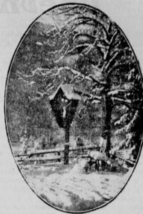
Idila s poti na Golico.

Zadnja leta naše smučarstvo res lepo napreduje. Danes so že več kot minuli tisti časi, ko je smučar s svojimi »dilecami« vzbujal pozornost na ulici in bil nemalokrat v zasmeh tudi onemu, ki poleti sicer rad zahaja v planine. Leto za letom se prav razveseljivo več število smučarjev in nekajkrat smo se že upali nastopiti tudi na inozemskih tekmah. Ta sport ni našel pristašev samo med mestnim prebivalstvom, goji ga čim dalje bolj tudi domača mladina povsod tam, kjer so ugodni smučski tereni. Brez dvoma se kaže prav lep napredek od leta do leta ne samo v zanimanju temveč tudi v tehničnem izpopolnjevanju. Letos bodo že drugič nastopili naši smučarji na zimski olimpiadi pred mednarodnim svetom. Vsako zimo se izvežba na številnih tečajih nov kader prijateljev tega sporta, ki mu ostanejo zvesti tudi preko prvega navdušenja.