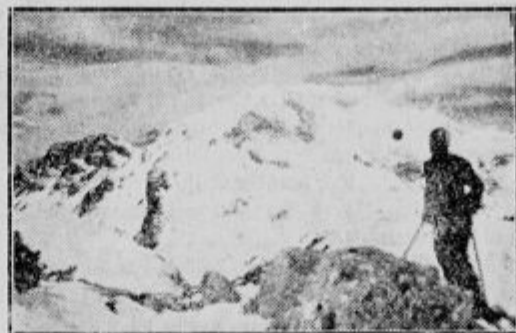
Planina Vogel nad Bohinjem.

Slovensko planinsko društvo opozarja smučarje in zimske turiste, da so tudi pozimi otvorene in oskrbovane sledeče postojanke: Hote' Zlatorog in hotel Sv. Janez ob Bohinjskem jezeru, Valvazorjeva koč pod Stolom in v Kamniških planinah poleg Doma v Kamniški Bistrici in Doma na Krvavcu še tudi koč na Veliki Planini. Erjavčeva koč na Vršiču (Kranjska gora) je otvorena in oskrbovana vsako soboto in nedeljo ter na praznike in na dneve pred prazniki. Za druge planinske koč se dobi ključ le za skupine pod vodstvom zaupnikov. Tozadevne informacije daje Osrednji odbor S. P. D. v Ljubljani in Zimsko-sportni savez v Ljubljani.