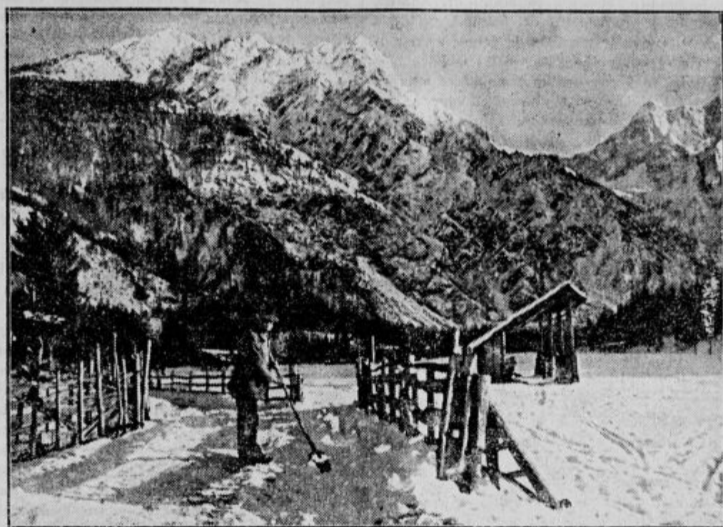
Vstop v Planico.

Zgodnja sezona za smučke sportnike se je obetala. Toda marsikdo, ki težko plača dinarje za vožnjo na Gorenjsko, se je veselil prezgodaj Prvi sneg nam je kar hitro izginil. Malo predsezono pa smo le imeli. Izrabili so jo najnepočakanejši sankarji, tisti, ki trije z enimi sankami v spremstvu hišne žige gredo poskušati prvi sneg pod Tivoli, na Golovec in rožniška pobočja. In pa smučarji-začetniki, ki jim je usojeno, da zaznamujejo precejšnje število »pik«, predno se bodo upali v Kranjsko goro, na Kofce ali pa na Veliko planino. Pa tega veselja je bilo kmalu konec. Tudi drsalce je prvo upanje varalo. Gore pa so se že odele z debelim snegom in za vsako soboto in nedeljo je že gotova »mobilizacija« smučarskih družb, ki bodo obiskovale Bohinj in krasno planino Vogel, stalne goste bosta imeli Kranjska gora s svojim lepim smučskim terenom in skrita Planica. Oživele bodo letos na novo Kofce, kjer bo smučarje sprejemala pod svojo streho nova koča, stari prijatelji Velike