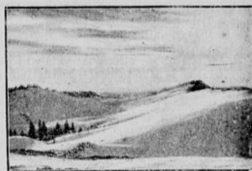
Na Veliki planini.

skrbljene z ugodnim snegom. Pa se bomo spet srečali stari znanci s planin, ni dolgo, ko smo se za kratek čas poslovili od njih in jih bomo pozdravljali v novem razkošju, ko bodo blestele v snegu, v solncu, lesketale kakor v biserih in se bomo pozdravili: smuk!