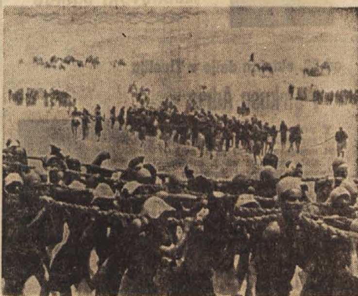
Brez tednika. Predstave ob 15, 17, 19 in 21. Ob 10 je matineja istega filma. V glavni vlogi: Jack Hawkins