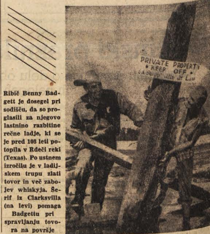
Ribič Benny Badgett je dosegel pri sodišču, da so pro- glasili za njegovo lastnino razbitine rečne ladje, ki se je pred 103 leti po- topila v Rdeči reki (Texas). Po ustnem izročilu je v ladijskem truplu zlati tovor in več zabo-jev whiskeyja. Se- rif iz Clarksvilla (na levi) pomaga Badgettu pri spravljaju tovo- ra na površje

Nobena jeklena žica ne more prenesti obtežitve več kot 50 kg na kvadratni milimeter, ne da bi se pretrgala. Pajčevina pa lahko nasprotno zdrži tudi 900 kg obte- žitve na kvadratni milimeter!