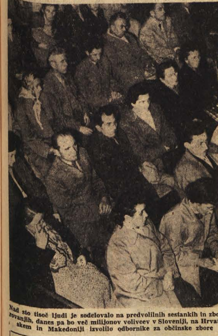
Nad sto tisoč ljudi je sodelovalo na predvolilnih sestankih in zborovanjih, danes pa bo več milijonov volivcev v Sloveniji, na Hrvaškem in Makedoniji izvolilo odbornike za občinske zборе