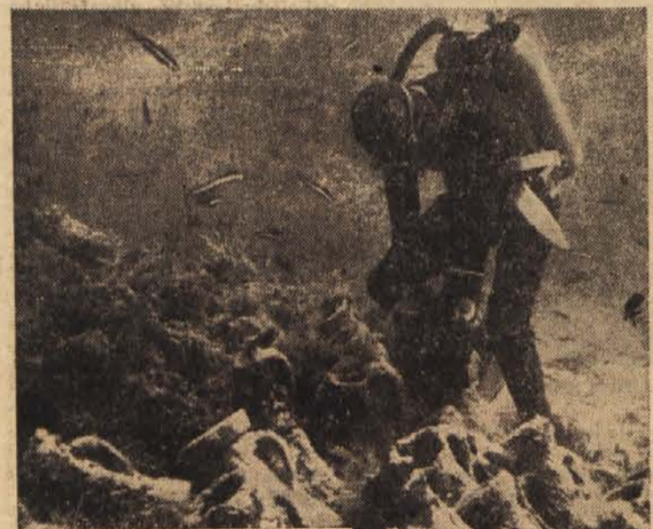
Skoraj 2000 let so ležali ti rimski vrči na morskem dnu pred Iledu- Levantom ob Azurni obali. V glo- bini 27 m jih je našel športni potapljač

Bolj zanimivo kot ti ostanki pa so osekakor razbitine stare, kakih trideset metrov dolge ga- leje, zakaj to pot so proci od- krili v sorazmerno majhni glo- bini skoraj povsem nepoškodova- vano ladjo s tororom orčev. Ko jo bodo spravili na površje, bo dobilo človeštvo dokaj nazor- nejšo predstavo o danem rim- skem ladjedelništvu.