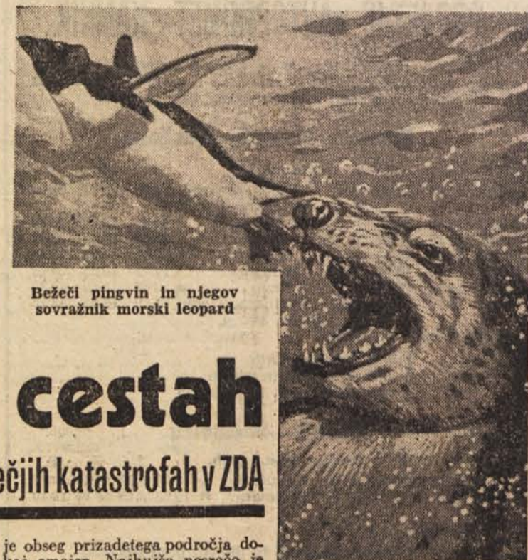
Bežeči pingvin in njegov sovražnik morski leopard

PRISPEVEK ZA NOVO PRESTOLNICO Premožni Brazilci, ki živijo na ozemlju ZDA, bodo poso- dili brazilski vlad 10 milijo- nov dolarjev kot pomoč za zgraditev brazilskega glavne- ga mesta, ki se bo, kot je že znano, imenovalo Brasilia.