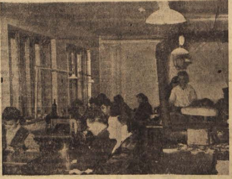
Delavnica obrtne zadruge »Kroj«

Tudi na prosvetnem polju bo moral pristojni svet ljudskega odbora posvetiti več pozornosti našim kulturno-prosvetnim društvom ter v najkrajšem času rešiti problem kino podjetja in dograditve kulturne dvorane v Zadružnem domu.