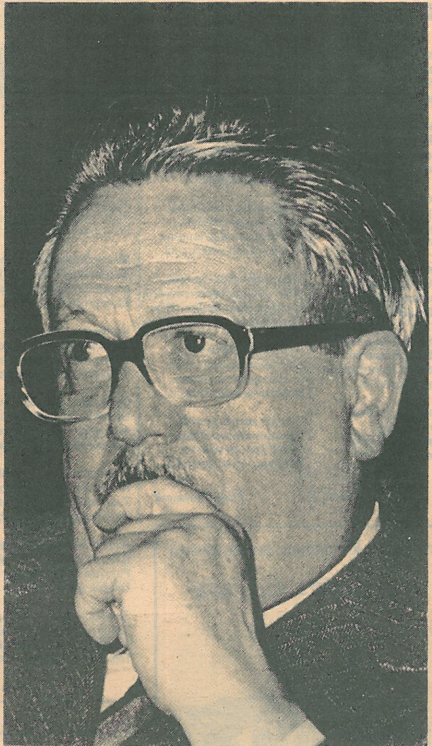
Edvard Kardelj—Sin Slovenije in Jugoslavije: Izguba katero je nenadoknodna.

V torek 13. februarja so v Ljubljani pospremili k zadnjemu počitku Edvarda Kardelja. Ljubljana še kaj takega ni vedela, kot se za pogrebne svečanosti spodobi je tudi ta dan deževalo.