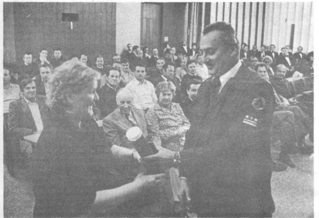
Letošnje tekmovanje prostovoljnih gasilskih enot je bilo množično!