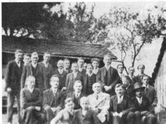
Prvi sestanek s predavanjem nove podružnice v št. Janžu na Vinski gori.