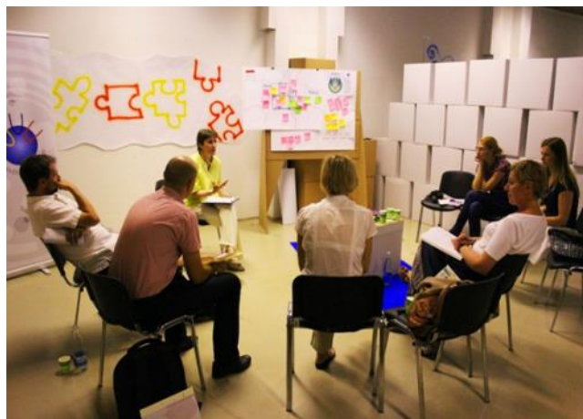
Izkustvena konferenca - izvedba metode U, foto: Pina Maja Bulc

SrCi Inštitut Maribor spodbuja celostno inoviranje po principu in & out. Od inoviranja v okolju preusmerja pozornost k inoviranju na globljih osebnostnih ravneh. S systemskega vidika sta potrebna oba, da bi razvili sposobnost primerno celostnega razmišljanja, odločanja in delovanja.