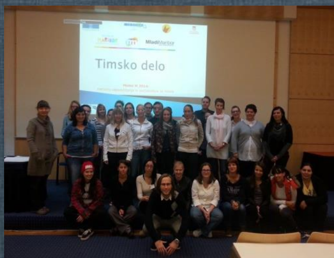
Udeleženci Modela M, foto: IRDO

Program je namenjen mladim brezposelnim med 24. in 30. letom iz regije Podravje, ki želijo izboljšati svoje kompetence, znanje ter pridobiti praktične izkušnje s pomočjo uveljavljenih podjetnikov in strokovnjakov - za večanje njihove zaposljivosti na trgu ali ustanavljanje lastne profitne oz. neprofitne organizacije. »Modelovci«, kot jih po domače imenujemo, se bodo v času intenzivnega dvomesečnega usposabljanja aktivno povezovali s podjetniki, nevladniki in udeleženci projekta Model M 2013 ter tako krepili svojo mrežo ključnih ljudi, ki jim bodo lahko pomagali na njihovi poslovni ali karierni poti. Marsikateri mladi se je po končanem študiju in daljši brezposelnosti ujel v začaran krog razočaranja, obupa in pasivnosti. Niso vedeli, kako naprej, služb namreč ni. Velik poudarek pri programu Modela M je tudi na spoznavanju samega sebe, svojih sposobnosti, veščin in vrednot, želja in interesov ter vključevanje naštetega v iskanje novih poti do ciljev. V Sloveniji je še vedno dokaj zakoreninjeno prepričanje, da naj bi počeli le to, za kar smo se izšolali. Program Mo-