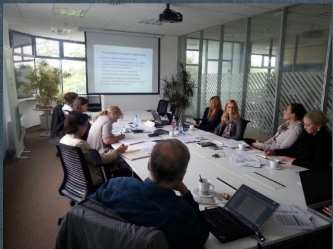
Seminar za prijavitelje je potekal 16. septembra v Ljubljani

Nagrado Horus bodo organizatorji v letu 2014 podelili že šestič, predvidoma v začetku decembra, kandidati pa se lahko zanjo potegujejo vse do 15. oktobra, ko bo razpis za nagrado v tem letu zaključen. »S strokovnimi podlagami inštituta IRDO lahko pravne osebe preverijo svoje izvajanje družbene odgovornosti v praksi ter spoznajo novosti, ki jih naj bi učinkovito vključile v svoje poslovanje. Vprašalnik za nagrado Horus 2014 smo prilagodili aktualnim zahtevam za razvoj družbene odgovornosti pri pravnih osebah v skladu z evropskimi in mednarodnimi usmeritvami. S tem spodbujamo podjetja k inoviranju, povezovanju zaposlenih, partnerjev, potrošnikov, skupnosti in k skrbi za okolje ter učinkovito vodenje v duhu osebne in družbene odgovornosti,« je o aktivno-