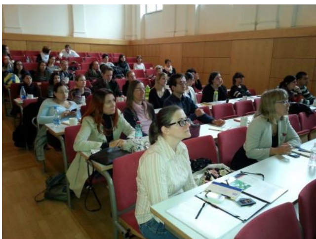
Udeleženci programa Model M na predavanju.

Za projekt je bilo letos veliko zanimanja, saj se je vanj prijavilo kar 56 kandidatov iz Maribora in Ptuja, v program pa kasneje vključilo 39. »Perspektivni mladi se bodo povezovali s pomočjo različnih druženj, poslovnih sodelovanj in dogodkov. Spoznavali bodo same sebe, uspešne in neuspešne podjetniške in nevladniške prakse, dobre in slabe delodajalce ter dosedanje izkušnje 1. generacije udeležencev projekta Model M 2013, s katerimi se bodo tudi aktivno srečevali v prihodnje,« je o vključevanju udeležencev dodala Anita Hrast, direktorica Inštituta IRDO in vodja projekta Model M 2014.