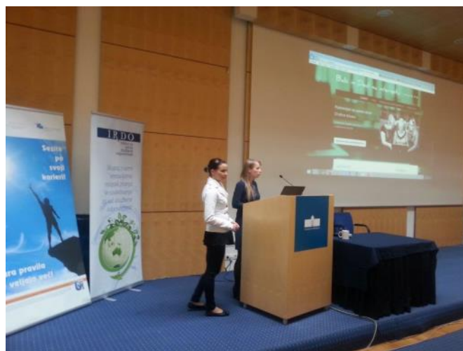
Utrinki s predavanj.