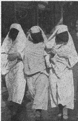
Tri zakrite lepoticé

Ašikovala Ajiša ni mnogo, ker se je kmalu poročila. Prej in večinoma še zdaj je navada, da se muslimanka brž kò postane zrela za možitev,