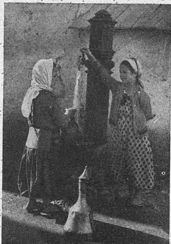
Dve mali muslimančici pri vodnjaku; na tleh je djugum, posoda za vodo; dekleti imata dimije in na glavi jemenije

pride v hišo, vzame dete na roke ter izmoli nad njim predpisane molitve ter pokliče dete po imenu, ki ga bo nosilo. Proslave ni, samo hodži postrežejo z najboljšim, kar je pri hiši. Moško dete se kasneje «suneti» (obreže). Ta običaj je obvezen tudi za Žide. Razlika je v tem, da pri Židih obrežejo dete vedno osmi dan po rojstvu, pri naših muslimanih pa so obrezovali nekaj kasneje, često ko je bilo otroku že dvanajst do trinajst let, «da se je zavedal važnosti dogodka». Danes je to prepovedano. Obrezuje se najkasneje do enega leta. To je za hišo vedno velik praznik, a samo za moške. Oče «časti» prijatelje in znance, ki zato obdarujejo dečka v denarju. Ta od vsega seveda nima ničesar razen bolečin; neredko se zgodi, da otrok zboli ali celo umre, zlasti če operacije ni izvršil strokovnjak. — Žensko dete pa knijejo, ko mu je pol leta ali več — to pa je hišni praznik za ženske.