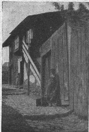
Revna muslimanska hišica na periferiji Sarajeva

Prvi petek po otrokovem rojstvu se zbero žene pri porodnici na mubarekj (praznik), da proslavijo babine. Porodnica takrat leži. Po ležišču in okrog njega razgrne vse najlepše, kar ima v hiši. Sama je belo oblečena in ima belo ruto na glavi; sploh hodi štirideset dni po porodu oblečena v belo in prve dni ne sme prestopiti praga njene sobe noben moški; tudi najbližji sorodniki, ki jim je to sicer dovoljeno, ne; edina izjema je mož. Žene, ki pridejo na mubarekj, obdarujejo mater in dete, njim pa postrežejo z rahatlokumom (turško slaščico), belo kavo in peksimetom (neke vrste bigami). Pozneje pride na vrsto sladka