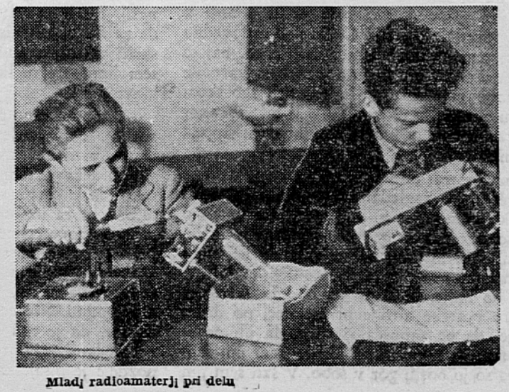
Mladji radioamaterji pri delu

ima radioklub Ljubljana I. v Kernikovi ulici 7 trenutno kar štiri tečaje, dva začetna A-tečaja, nadaljevalni B-tečaj in telegrafski tečaj za bodoče sprejemne in oddajne radioamaterje. Razen tega deluje v februarju nov A-tečaj in višji radioamaterski C-tečaj, na katerih se tečajniki učijo vsega, kar je treba vedeti o radiu in elektrotehniki.