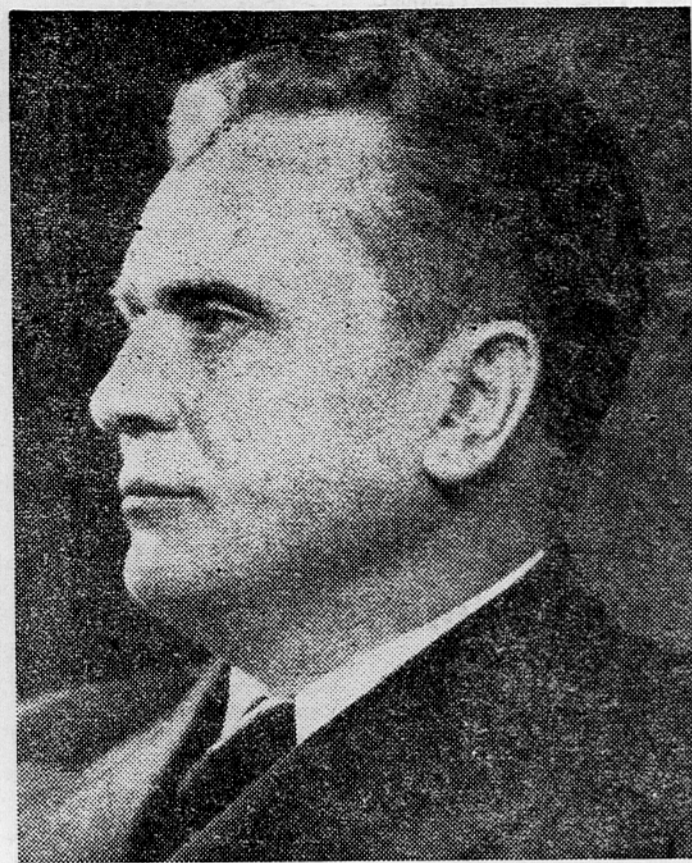
Sprejem pri maršalu Titu Beograd, 22. februarja. Predsednik republike Josip Broz Tito je sprejel danes ob desetih uri dopoldne izrednega in pooblaščenega veleposlanika Vel. Britanije v Jugoslaviji sira Yva Malleta.