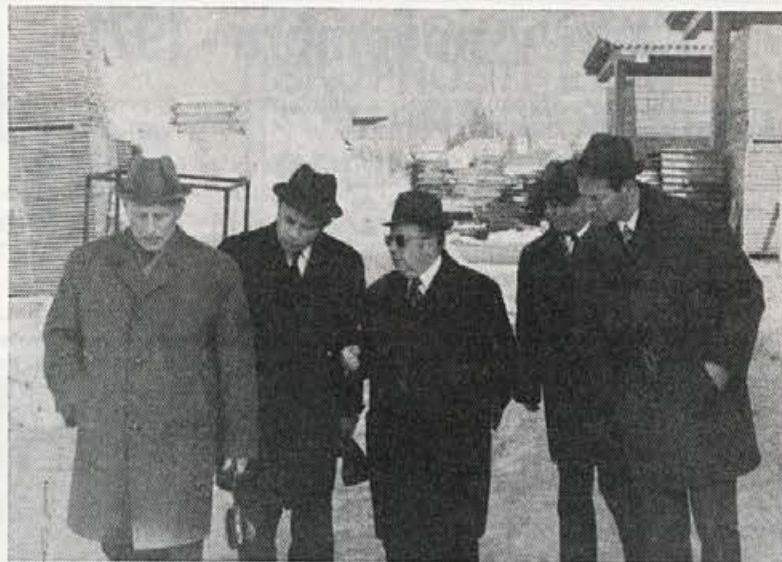
Ruska gospodarska delegacija v Elanu

Vinka z 1950 din nagrade za tehnično izboljšavo pri košari za jedkanje robnikov.