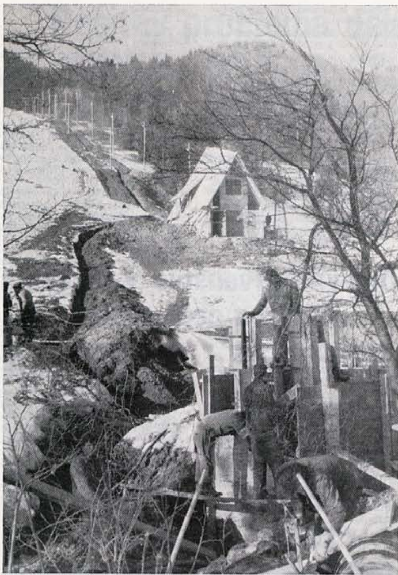
Krpinj — smučarski center v Begunjah