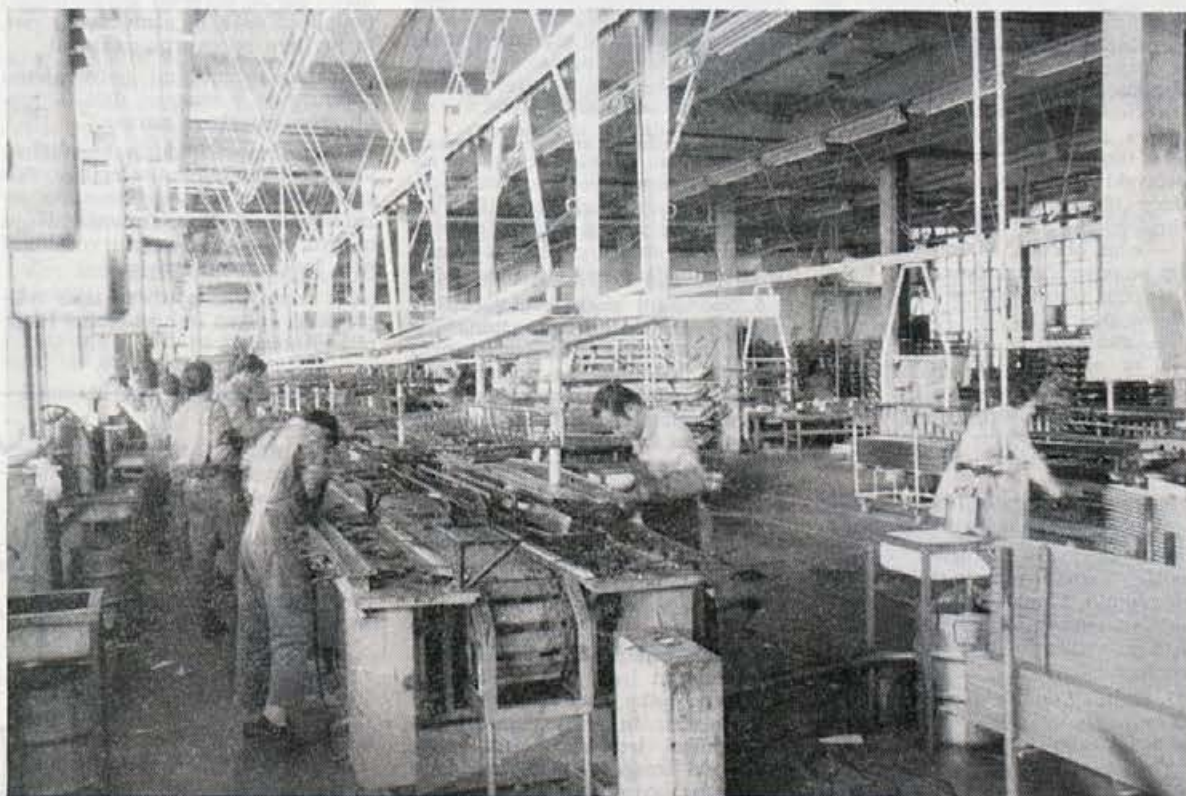
Stekel je prvi tekoči trak v proizvodnji smučil