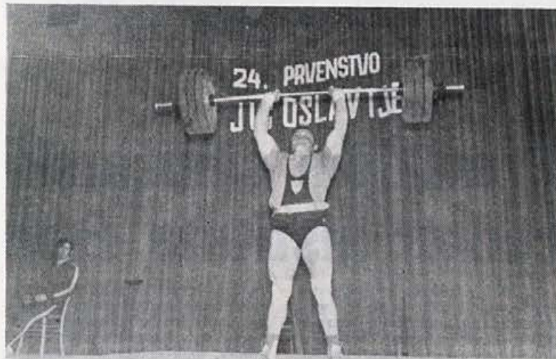
Nastop državnega prvaka z našo ročko

Zato moramo tudi mi posvetiti še večjo pozornost razvoju uteži ter ostalega orodja. S. K.