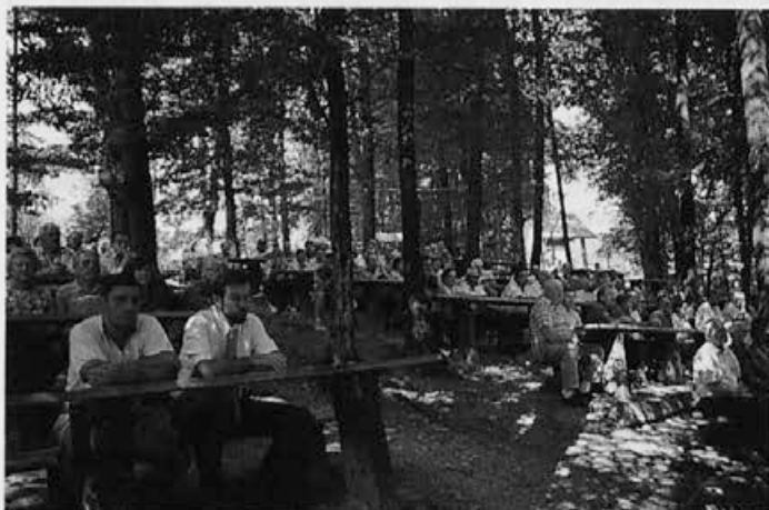
Pogled na prireditveni prostor v gozdličku nad Lukovico, kjer so se zbrali čebelarji.