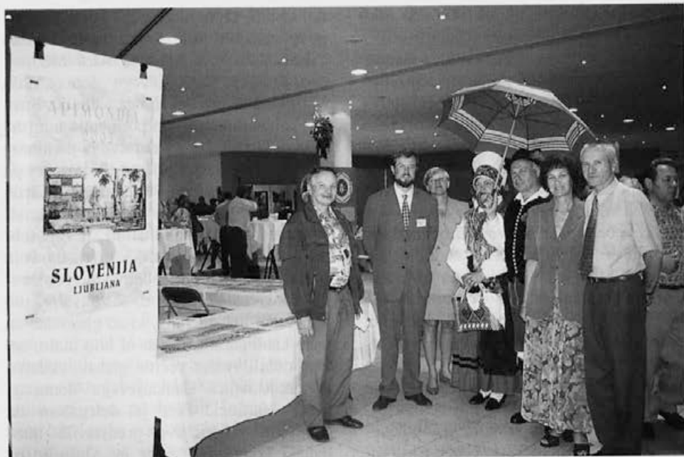
Tako smo se slovenski čebelarji predstavili udeležencem kongresa v Belgiji.