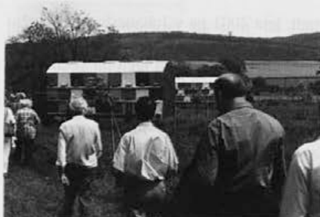
Vedno več čebelarjev pri nas se odloča za prevoz čebel s kontejnerji.

gosto, toplo sladkorno raztopino. V normalnih razmerah je treba čebele nakrmiti že ob koncu avgusta in septembra. V takšnih razmerah pa je pozno krmljenje manj tvegano kakor zazimitev z neprimernim medom. Sicer pa smo nekoč, ko je na naših poljih še cvetela ajda, čebele normalno dokrmili šele v začetku oktobra. Glede poznojesenskega zatiranja varoe se držite navodil vašega območnega veterinarja. Tega pomembnega opravila nikakor ne smete opustiti.