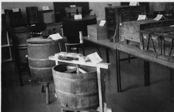
Mnogo čebelarških društev prireja zanimive čebelarške razstave. Poskrbimo, da se to narodno blago ne porazgubi.

tega muzeja pa je bila tudi tedanja Zveza čebelarških društev Slovenije.