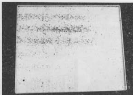
Po odstranitvi mrežice preštajemo varoje, ki so odpadle v sedmih dneh.