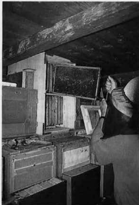
Medišča panjev so bila letos le redkokje polna, le izredno močne družine so dale eno točenje, turi pri g. Debelaku iz Bleda.

gosto, toplo sladkorno raztopino. V normalnih razmerah je treba čebele nakrmiti že ob koncu avgusta in septembra. V takšnih razmerah pa je pozno krmljenje manj tvegano kakor zazimitev z neprimernim medom. Sicer pa smo nekoč, ko je na naših poljih še cvetela ajda, čebele normalno dokrmili šele v začetku oktobra. Glede poznojesenskega zatiranja varoe se držite navodil vašega območnega veterinarja. Tega pomembnega opravila nikakor ne smete opustiti.