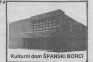
Kulturni dom ŠPANSKI BORCI

Tema vsekakor nudi obilo možnosti tako za zabavne kot