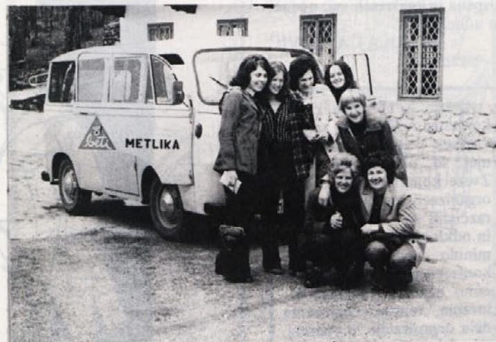
Ekipe prve pomoči iz naše tovarne je šla aprila na izlet. Dekleta so bila v Bohinju, na Bledu, v Škofji Loki, Tolminu, Novi Gorici, Postojni, Seči, Puli in na Reki. Na izletu je bilo čudovito in se zahvaljujejo tovarni, ki jim je posodila kombi. Denar za izlet so dekleta dobila tako, da so se odpovedala plačilu ur med pripravami za občinsko tekmovanje