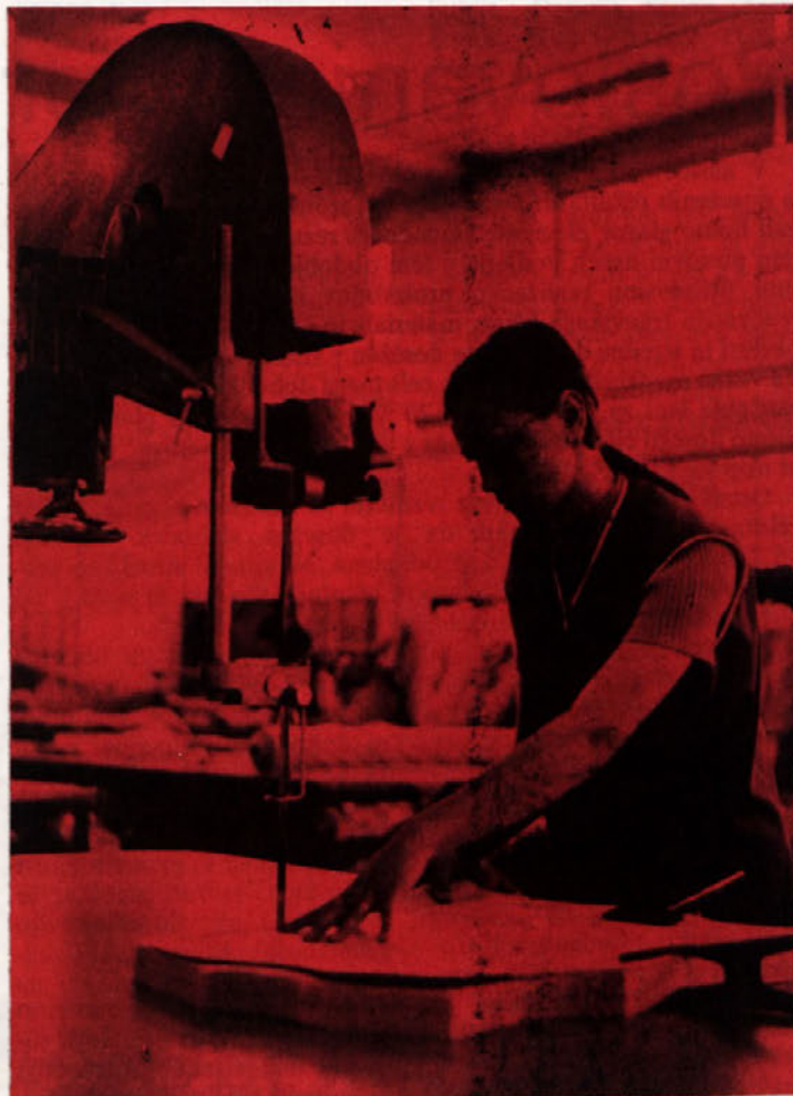
Dan mladosti je mimo, mladi ustvarjajo naprej. Povsod so zraven: na polju, v tovarni, v samoupravljanju, pri zabavi. Čeprav z zamudo – iskrene čestitke za njihov praznik tudi v našem Vezilu!