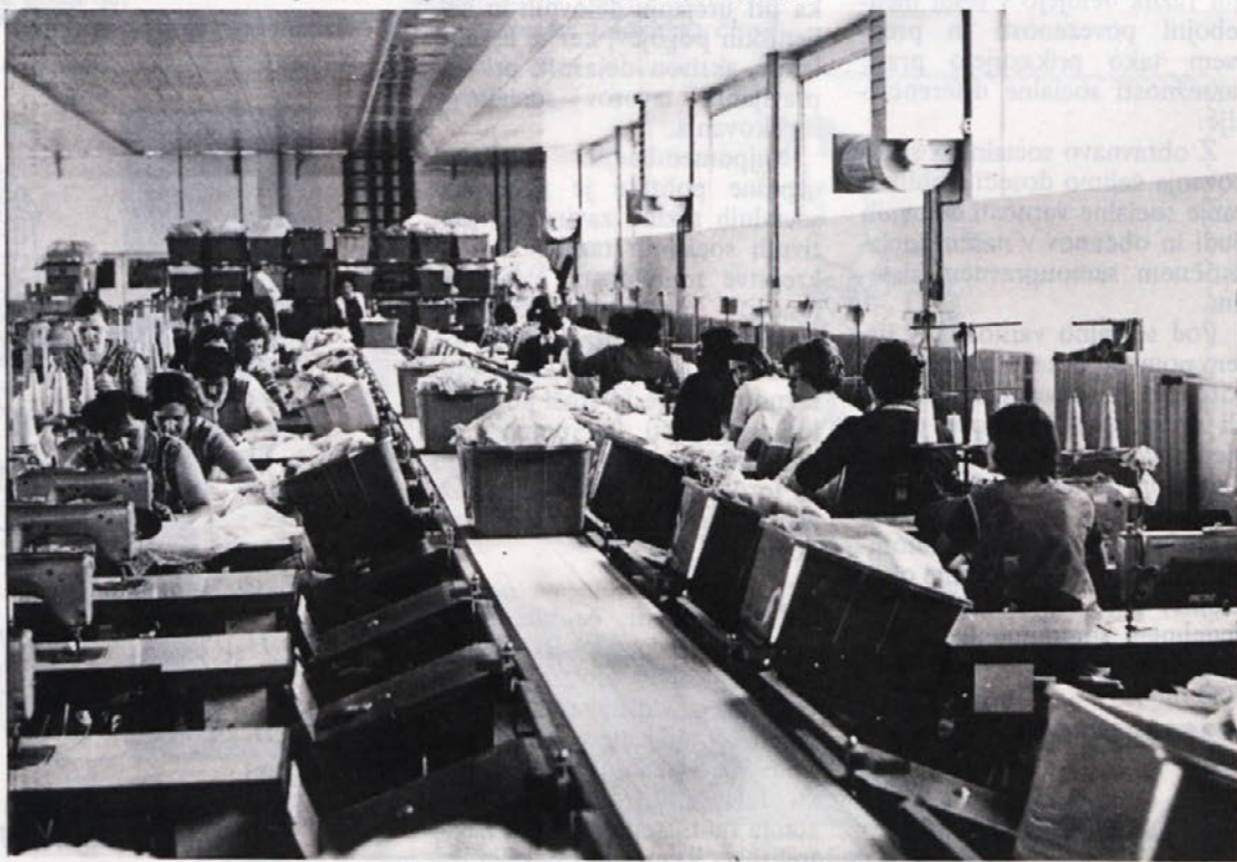
Prostori v Dobovi so zračni, svetli, novi. Na tekočem traku, kjer delajo pretežno ženske, je delo postalo prijetnejše.