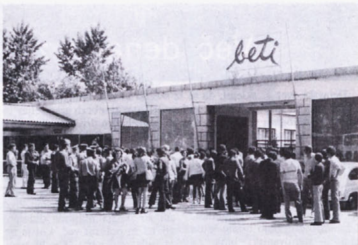
Okrog 350 mladih Karlovcianov si je ob svojem obisku pri metliški mladini med drugim ogledalo tudi našo tovarno. Bili so prijetno presenečeni.