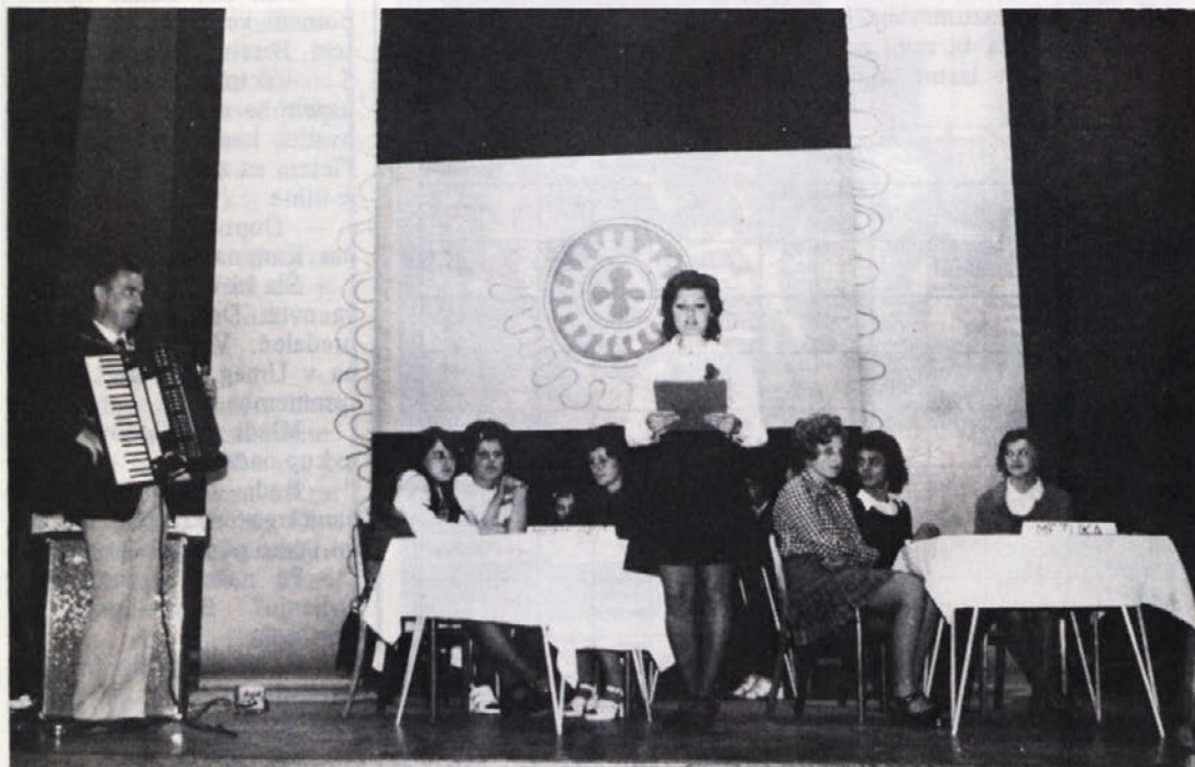
Na kvizu, ki so ga pripravili mladi iz Beti, je zmagala ekipa domače tovarne