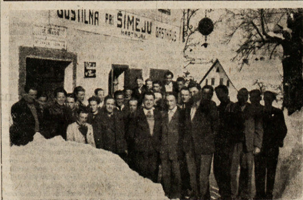
Skupina udeležencev po prvem predavanju kmetijskega visokošolskega tedna v Št. Jakobu v Rožu

Kodanj. — Danska ne bo poslala svoje delegacije na gospodarsko konferenco, ki bo prihodnji mesec v Moskvi. Kakor se je zvedelo, je tudi Nizozemska odklonila udeležbo na tej konferenci.