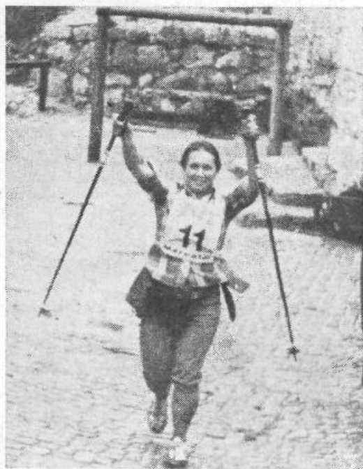
Edina tekmovalka »nežnega spola« ni bila na vrhu prav nič utrujena

odpravil na svoj običajni nedeljski izlet in pri gostilni naletel na množico tekmovalcev. »Pa dajte še meni številko«, je rekel. In zanj je obveljal izrek »Prišel, videl, zmagal...«