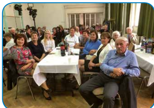
Dvorano so napolnili povabljeni gostje pa členi sombotelskoga slovenskoga društva

nike Franceka Mukiča, stero je dugo držalo (venej se je že kmica delala), je pá pokazalo, ka nas