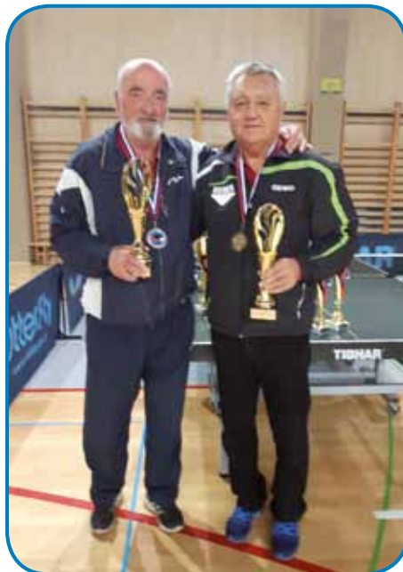
V kategoriji dvojic (med tistimi, steri so stari več kak 60 let) je biu drugi v rosagi

ženov dosta cajta v gorica, vej pa radiva delava z grauzdjon. Pravijo, ka penzionisti nikdar nemamo cajta, ali če maš volau delati, si tudi cajt najdeš. Vsakši den zrankoma se dobimo tudi