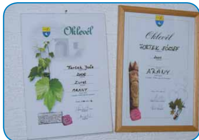
Fartekovi so na ocenjevanji vina v Tordasi že večkrat daubili priznanje

do te že vsi leko sprobavali tau prekmursko dobrou. Poskrbeli smo tudi za muziko, pripravljamo pa ške eno presenečenje za obiskovalce.«