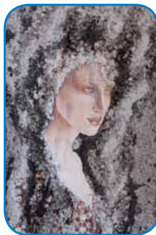
Ena od stvaritev