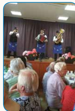
MI SE MAMO RADI... stran 9