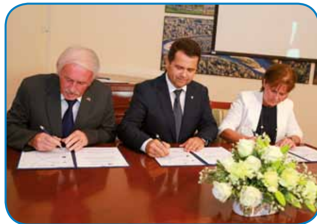
Sporazum o sodelovanju pri projektu Lendava-EPK 2025 sta z lendavskim županom podpisala predsednika obeh krovnic organizacij Porabskih Slovencev