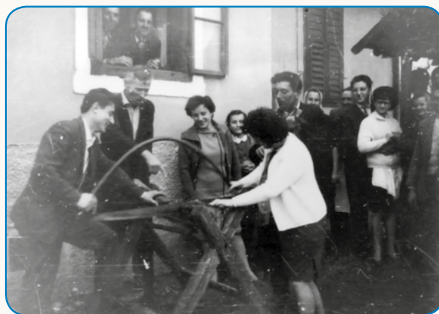
POD ZVEJZDAMI SMO SPALI stran 8