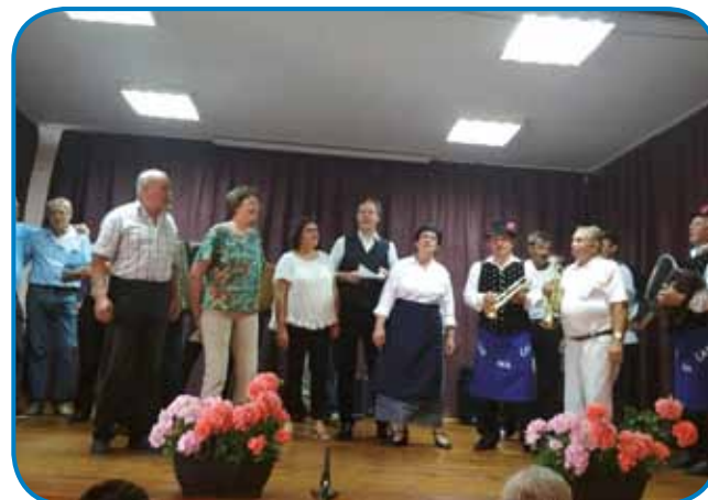
Vsi nastopajoči spejvajo pesem V dolini tihi ...