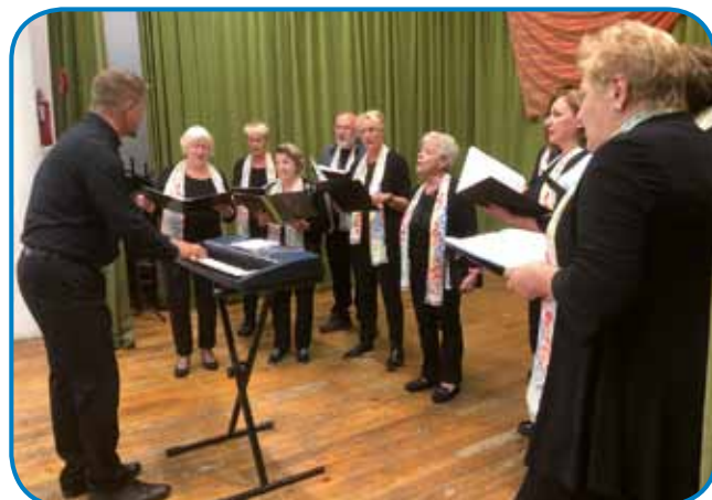
Zbor Pavlove hiše iz Potrne