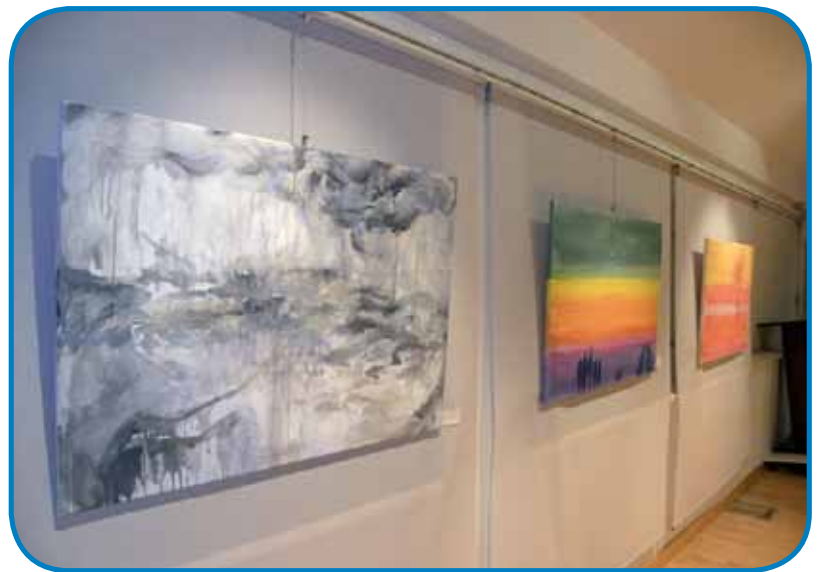
V Domu Števana Küzmiča je odprta tudi pregledna razstava del mednarodne likovne kolonije Primož Trubar, ki je od leta 1995 v Moravskih Toplicah

umrl leta 1779, je bil najznamenitejši. Primerjamo ga lahko z reformatorjema iz Kranjske, Trubarjem in Dalmatinom. Iz grščine je v slovenščino prevedel Novo zavezo «. Če Prekmurci ne bi imeli jezika, narodne zavesti in identitete, delegati na pa-