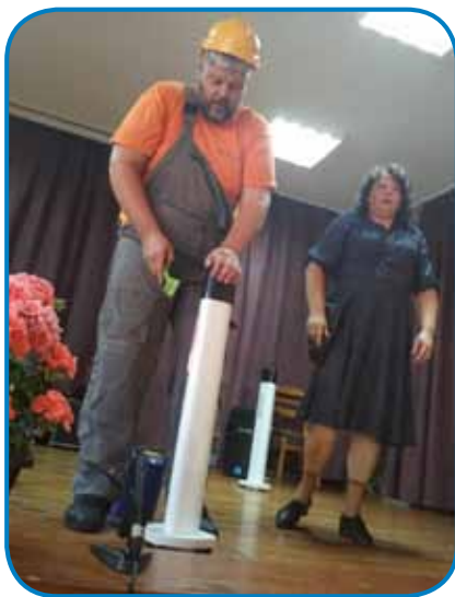
Gledališka skupina iz Pečarovec

Pá smo eden lejpi zadvečerek doživeli. Dostafart smo vküp