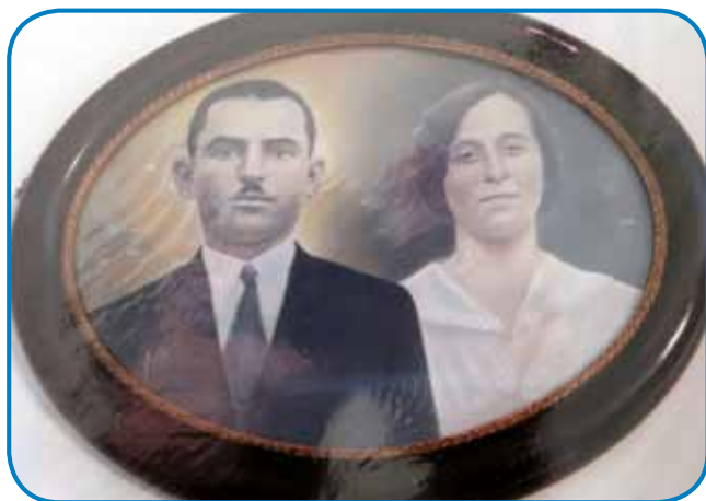
Njgva stariša, mati pa očé, na starom kejpi

»Tau je tak, kak praviš, gnesden telko vse nauvoga je, ka dja se k taumi že ne razmejm. Dja sem že v penziji, podjetje sin pela tadala, če kaj trbej, te pomagam, dapa ovak dja že ne delam pa že ranč bi se nej razmo tak vcuj kak trbej. Moj oča je dvanajset lejt v Braziliji delo še pred drügov svetovnov bojnov, gda je tøj doma nej bilau dela. Oča je mojoj materi karto poslo za šift, aj dé za njim, dapa mati nej stejla. Še pred bojnov so tam v Braziliji njim prajli, če stoj domau štje titi, aj dé, zato ka če vövdari bojna, te več nikam nedo mogli. Te je oča nazaj domau prišo pa njega so tak nagnauk za sodaka zvali. Gda je domau prejšo