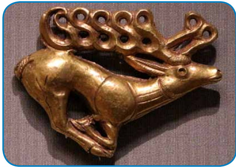
»Čüdivitni djelen« je pelo hunsko-vogerskiva brata Hunora pa Magora v nauvo domovino