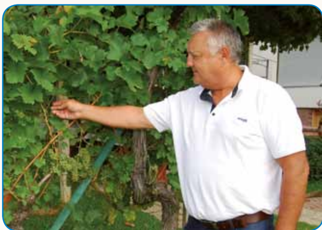
BIGIKLIJADA IN DÖDOLIJADA stran 5