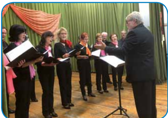
Komorni pevski zbor ZSM iz Monoštra

nje perdja itd.) gde je pesem vsigdar pauleg bila, gde so se mladi od starejši včili. Zatok je samo