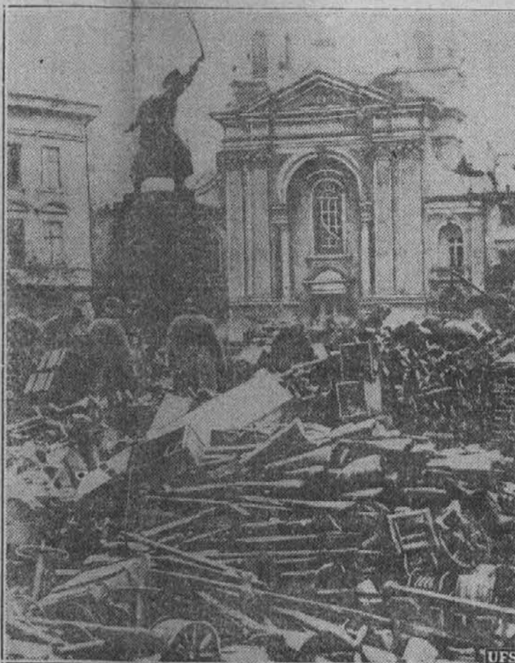
Poljsko orožje na glavnem trgu Varšave, ko so mesto zavzeli Nemci.