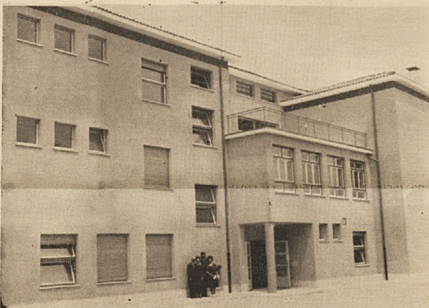
Prenovljeni slovenski dijaški dom v Gorici. Dom se nahaja na Sveto- gorski cesti št. 84