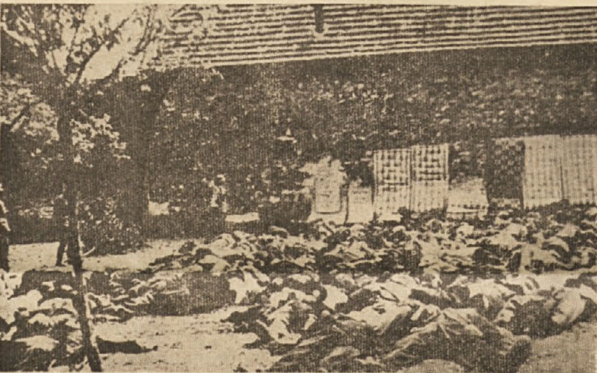
Lidice: trupla 163 moških, ki so jih nacisti ustrelili dne 10. junija 1942

Preteklo nedeljo je bila v novih Lidicah svečana komemoracija, katere se je udeležila velikanska množica ljudi. Na komemoraciji je govoril tudi predsednik republike Novotny.