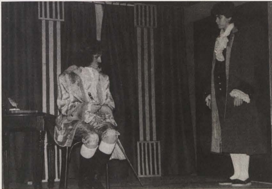
Uprizoritev Calderonove igre „Dama škrat“ je navdušila.