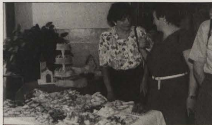
Pecivo je pritegnilo pozornost obiskovalcev

Vendar pa je bilo tudi na tej prireditvi čuti kritična mnenja: neka obiskovalka (ime je znano) je dejala, da šola „producira perfektne ženske za kuhinjo in gospodinjstvo“, to pa da je navprek z dejstvom, da se „po drugi strani borimo za žensko enakopravnost“.