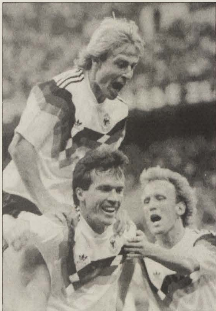
Matthäus in Brehme se veselita zadetka Klinsmana (zgoraj) proti Nizozemski.

katerem so Argentinci zmagali z 1:0 – in to kot slabša ekipa. Velika pozornost opazovalcev velja tekmii osmine finala med Jugoslavijo in Španijo, ki bo na sporedu danes zvečer ob 17. uri, domačini pa so že včeraj upali na uspeh svoje „squadre“ proti Urugvaju. V primeru uspeha bi Jugoslavija igrala v četrtini finala proti Argentincem (30. junija).