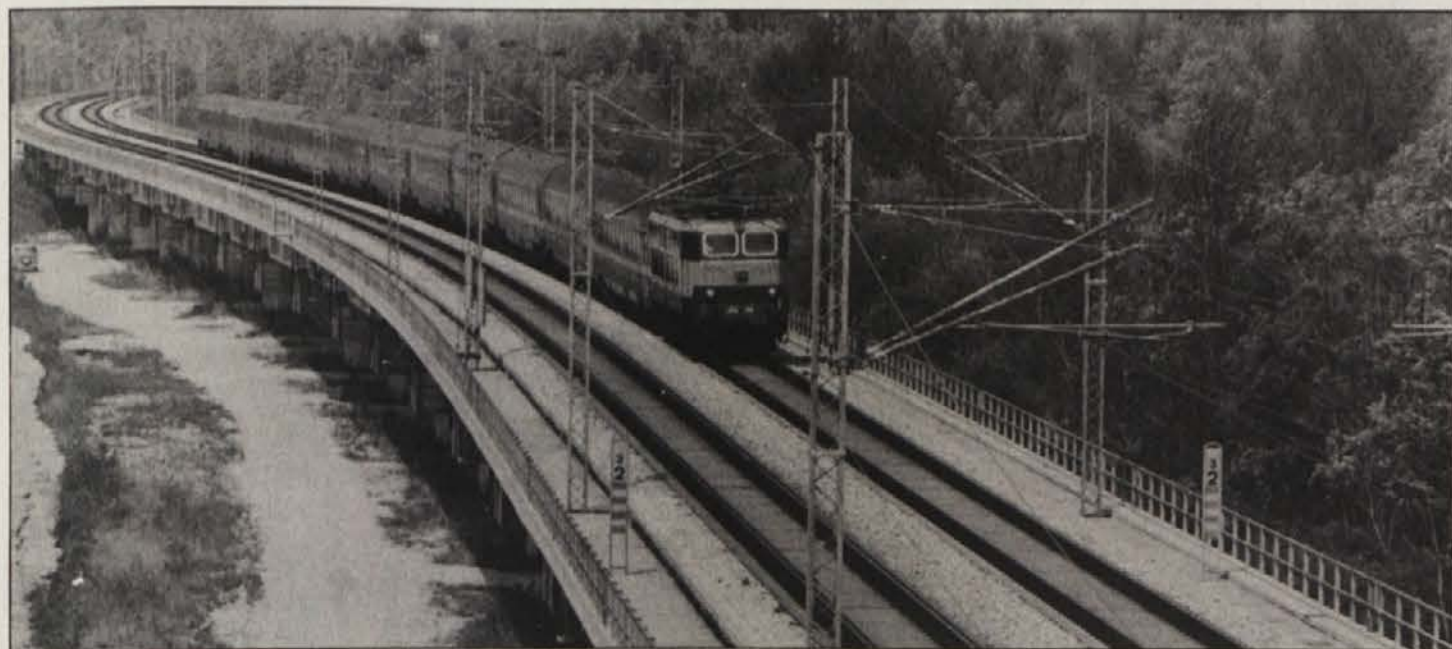
Viadukt „Rivoli bianchi“ blizu mesta Venzone je s 1050 metri najdaljši most, zgrajen pa je po novem načinu gradnje, ki dopušča hitrosti nad 200 kilometrov na uro.