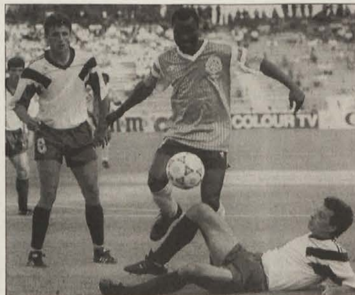
Kamerunec Roger Miller (v sredi) odločil tekmo...