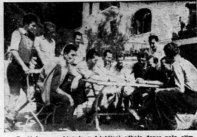
Po 14-dnevnem bivanju v Ljubljani odhaja danes naša olimpijska nogometna reprezentanca v Helsinkij, kjer se bo v prvi tekmi pomerila z izbranimi nogometaši Indije. Po formi, kakršno so v nedeljo pokazali reprezentanti, smemo upati, da bodo Jugoslavoiv častno zastopali svojo državo na olimpijskih igrah. (Na sliki: Pomepek na vru hotelu Bellevue.)

In končno bi poudaril še vprašanje revizijske službe. Od vsepovsod prihajajo pisma, da v zadrugi ni nekaj v redu. Sami ste v diskusiji navajali, da se marsikdo ne more odločiti za zadrugo, ker ni na jasnem, kakšno je notranje poslovanje kmetijskih zadrug. Zaradi tega bo treba brez dvoma jacti revizijsko službo, dati našim revizorjem tisto mesto, ki jim gre. Poleg tega pa moramo revizijsko službo postaviti na terenu tako, da bo vsaka naša zadruga delala v pričakovanju, da lahko