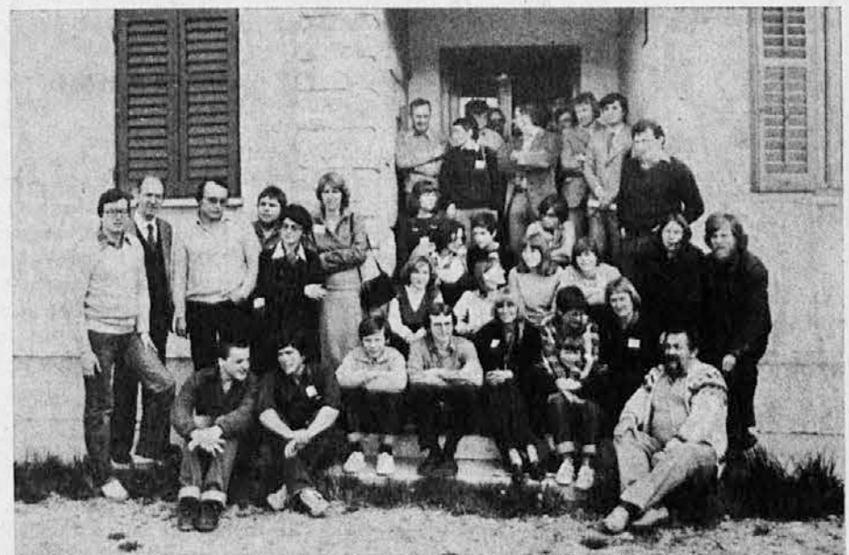
Udeleženci mednarodnega seminarja FUENS 1980 pred poslopjem SLOKAD v Dragi