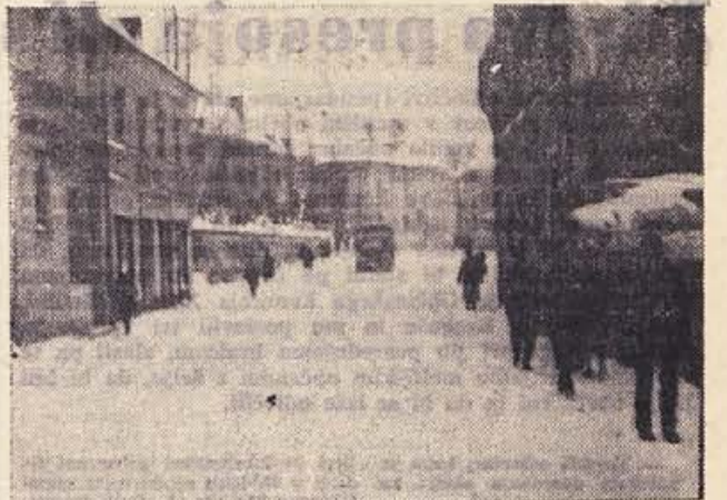
Podoba teh dni v Novem mestu

Organizacija SZDL Novo mesto — center šteje danes že nad 160 članov in je ena najmočnejših v novomeški občini. Izdaja glasilo, ki so ga najprej tiskali v nakladi 400 izvodov, do konference je izhajalo v 700 izvodih, zdaj pa nameravajo naklado povečati na okrog 900 izvodov. Kaže, da je glasilo med članstvom zelo priljubljeno in bodo odslej pisali vanj tudi člani (do zdaj so ga sestavljali le člani odbora), kar