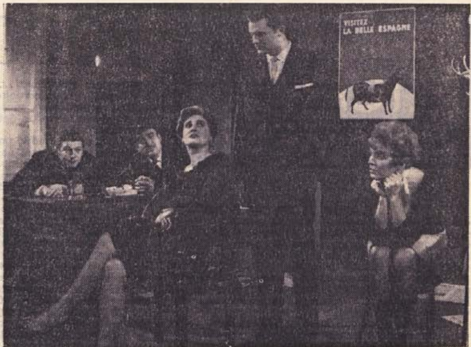
Frizorček iz ODKRITOSRČNE LAŽNIVKE, kateri je avtor pripisal tale motto: »Kdor govori resnico, temu daj konja: potreboval ga bo, da bo lahko pobegnil... (perzijski pregovor). Celjski umetniki bodo nastopili z Achardovo komedijo v soboto zvečer ob 19. uri v Kostanjevici na Krki