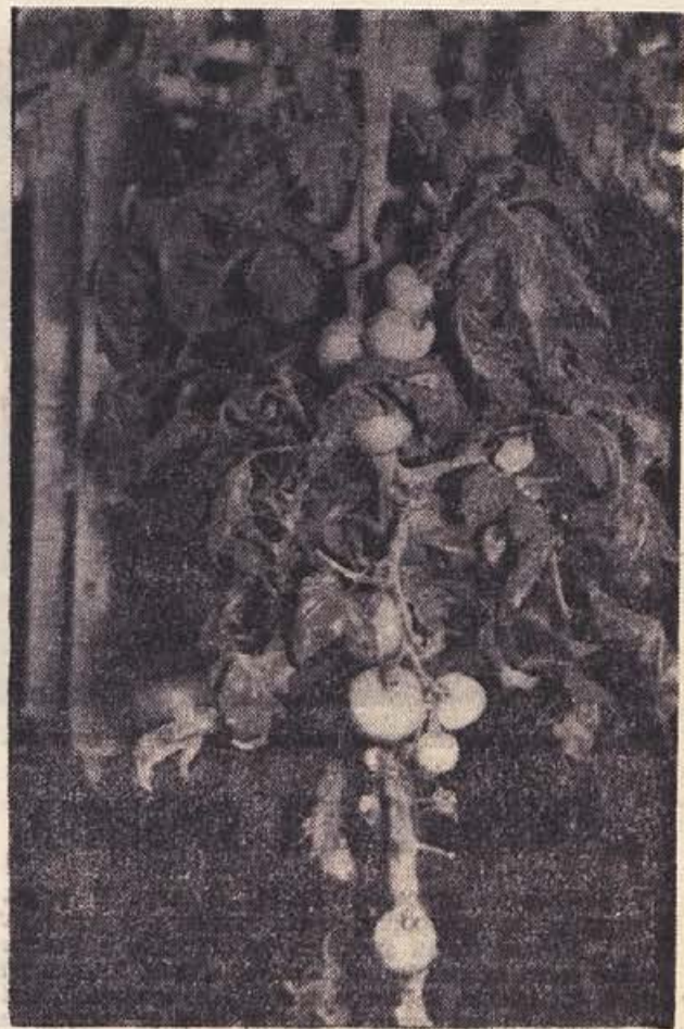
Tako raste v teh mrzlih zimskih dneh paradižnik v čateškem rastlinjaku. Prepričajte se sami, da ga ne »delajo v topli vodi«, kot govorijo nekatere lahkoverne novomeške gospodinje. Stebla so prav takšna, kot jih ima paradižnik, ki ga gojimo sami, le malce močnejša so, listje je prav tako zeleno, sadež pa rdeč in sočen. Na nekaterih sadikah zraste tudi po 30 in več sadov. Naš posnetek je bil narejen 16. januarja dopoldne, ko je bilo na prostem 20 stopinj pod ničlo! Levo zadaj: ogrevalne cevi za vročo vodo.

Rastlinjak v Čatežu je bil zgrajen s 162 milijoni dinarjev družbenih sredstev, predvsem za potrebe našega po-