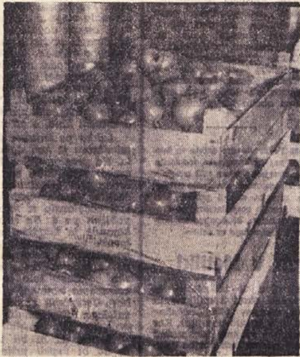
Obrani paradižnik v rastlinjaku je že stehlan in naložen v gajbice, čaka na odpremo. Obirajo vsak teden enkrat. Ponovno se nam vsiljuje vprašanje: zakaj vse doslej ni našel poti v naše mesto?

Najmanj paradižnika je potrošniku nudila trgovina. Splošno trgovsko podjetje v Sevnici ga je prodalo 112 kilogramov, v Brežicah so ga prodali 65 kilogramov, novo-