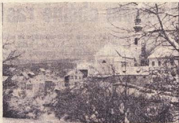
Metlika v beli odeji

KOZERIJA, KI PA NA ŽALOST LE NI KOZERIJA