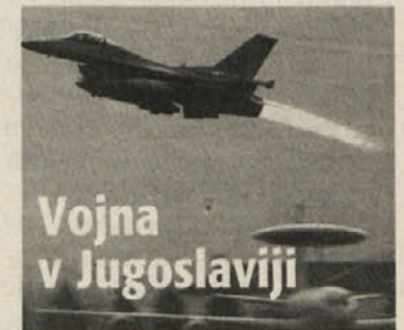
Vojna v Jugoslaviji

10. Upravni organi Zvezne republike Jugoslavije naj podprejo z vsemi primernimi sredstvi in prioritarno vse transporte osebja, vozil, ladij, letal, opreme ali preskrbo v začnem prostoru, preko pristanišč, cest ali letališč.