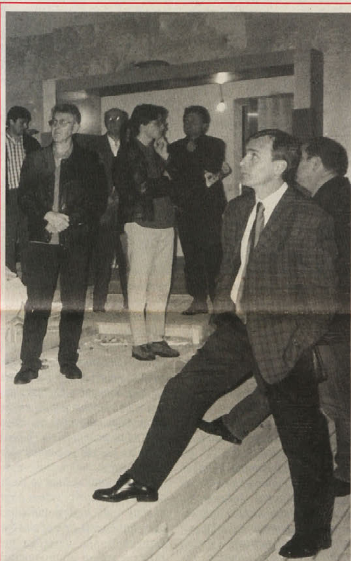
Predstavniki vseh osrednjih političnih in kulturnih organizacij so se pretekli četrtek seznanili s stanjem gradnje kulturnega doma v Pliberku

Vsem darovalcem pomoči se pristrčno zahvaljujemo, ostalim pa se priporočamo. Položnice so na vseh posojilnicah. Naslov: Posojilnica-Bank Bilčovs, konto številka: 31.064.837 – BLZ 39101.