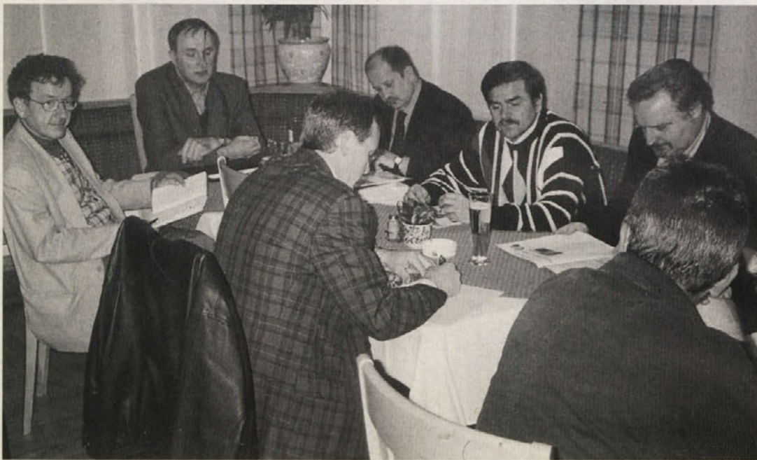
Z vroče, polemične in na koncu celo konstruktivne debate v Pliberku

Kar precej hude krvi je bilo prelite, dokaj žolčna je bila razprava, precej govora je bilo o finalnem predračunu, ki da je nepregleden in tudi neresen, nazadnje pa so tako predsednik ZSO Sturm kot predsednik