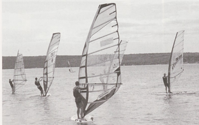
Na regati Piranja pri Bernardinu je sodelovalo več kot 60 deskarjev.

Jadralni klub Pirat Portorož je v sodelovanju z Jadralno zvezo Slovenije 5. septembra organiziral že drugo mednarodno športno- družabno prireditev Windsurf regato PIRANJA 2009.