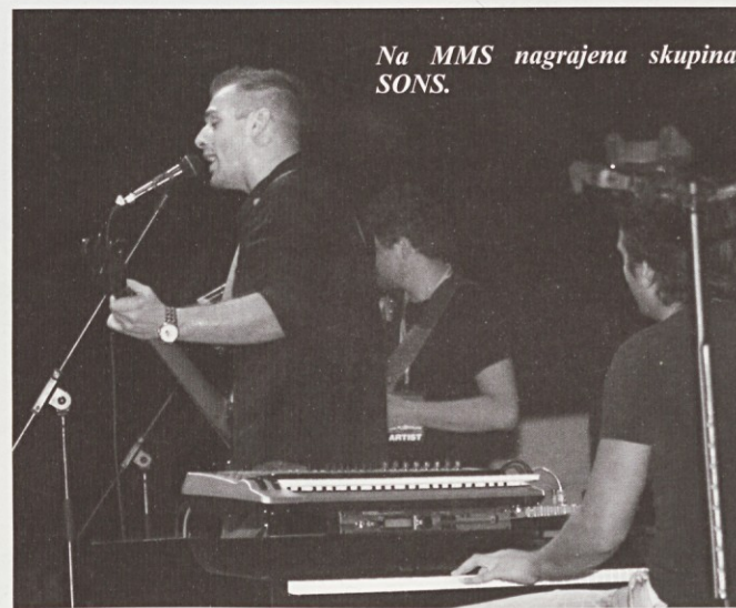
Na MMS nagrajena skupina SONS.