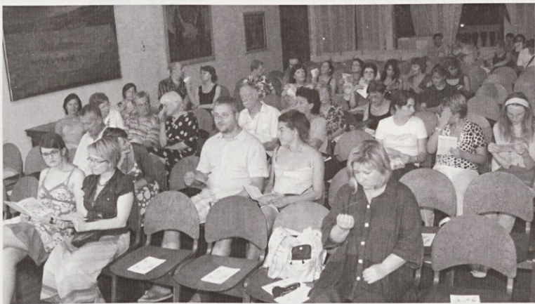
Kljub neznosni vročini je bilo v dvorani prijetno vzdušje.