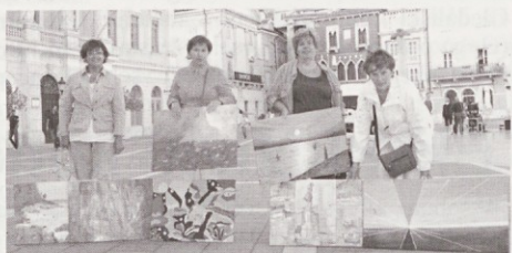
Razočarane iz Domžal. Nič dobile.