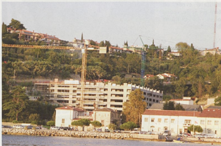
Pogled na novo garažno hišo pred Piranom.