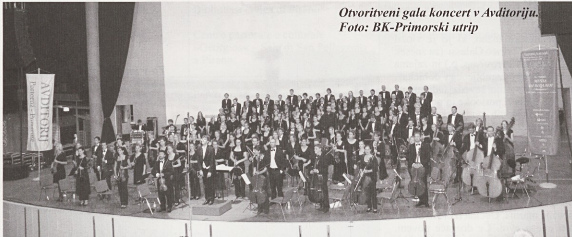
Otvoritveni gala koncert v Avditoriju.

Z Verdijevim Rekvieom se je v Avditoriju začel osmi Tartinijev festival, ki je trajal od 28. 8. 2009 do 12. 9. 2009 na različnih prizoriščih v Piranu in Izoli. Verdijevo največje sakralno delo je tako po nekaj letih ponovno na slovenskih odrih in na Primorskem smo ga slišali prvič. Občinstvo portoroškega amfiteatra je z gromkim aplavzom izkazalo navdušenje nad to nepozabno glasbeno izkušnjo.