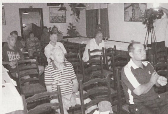
Tokrat se je razprave udeležila le peščica sogovornikov. Eden izmed njih je potožil, da naj bi bil Krajinski park svojevrsna ovira napredka, saj ne more nič spremeniti, dozidati...

Na še enem od številnih pogovorov, ki ga je 28. avgusta v Gostilni Ribič na Seči organizirala CI glede natrpanosti kanala s "črnimi" privezi in iskanja ustreznih rešitev, so sogovorniki končno prišli do nekaj ključnih spoznanj.