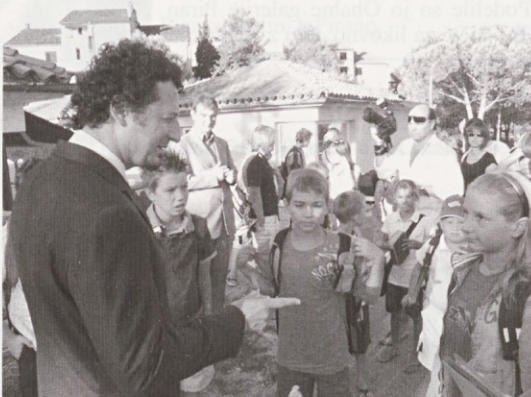
Minister Vlačič : Bodite previdni na cesti!

Obisk ministra je na ta način tudi zahvala vsem prostovoljcem iz