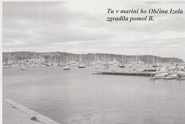
Tu v marini bo Občina Izola zgradila pomol B.

Občina bi torej morala dobiti od Marinvesta okrog 400 tisoč evrov letno. Vse to so preverile naše službe. Občina Marinvestu ni izstavljal računov, ker smo se stalno pogajali. Marinvestu smo ponudili celo koncesijo. In kaj je občina želela od Marinvesta? Da dokonča pomol A, marino oziroma pomol B. Ta sedanja oblast z mano na čelo pa je želela, da se razdeli na polovico Občini in Marinvestu, na kar pa gospod