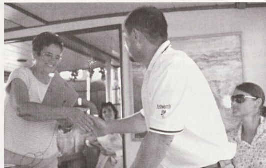
Podelitev priznanj sponzorjem.

Članice bodo odigrale 32 tekem, mladinke pa 16.