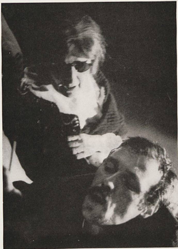
Tone Partljič: Oskubite jastreba Režija: Franci Križaj Premiera 14. X. 1977