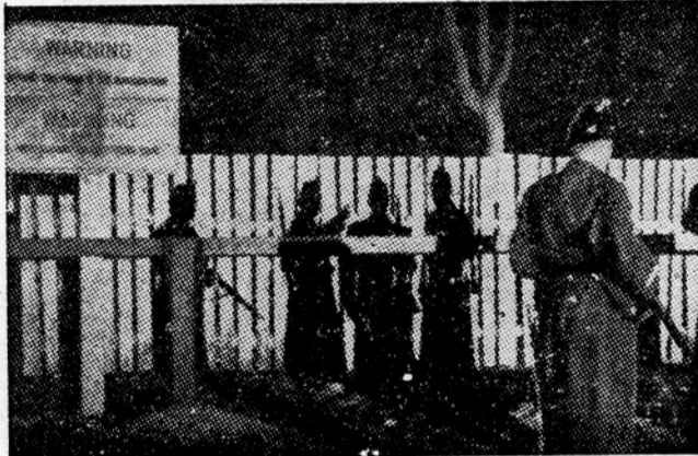
Z meje med vzhodnim in zahodnim Berlinom

Kontrola na vseh prehodih iz vzhodnega v zahodni Berlin, koli-