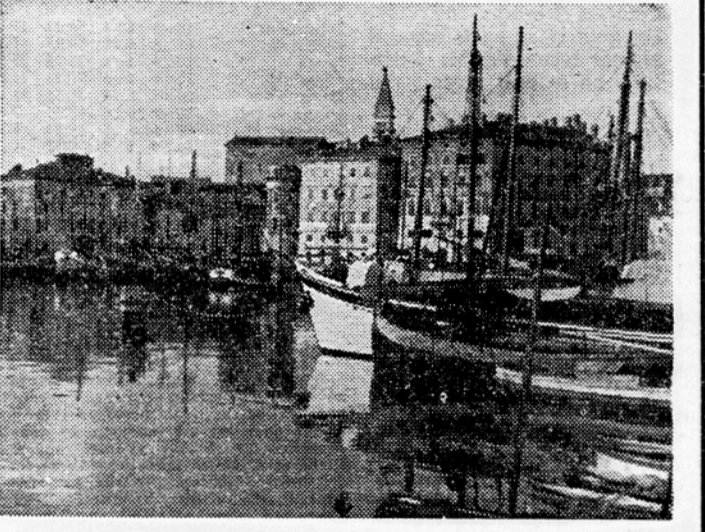
Pogled na Piran

Slovenska pomorska akademija je bila ustanovljena 4. oktobra 1945 z odlokom Pokrajinskega narodno - osvobodilnega odbora za Slovensko Primorje in Trst, ki je takoj po osvoboditvi spoznal važnost takega zavoda, ki bi vzgajal slovenske pomorščake, naslednike svetokriških ribičev in čuvarjev slovenske obale. Pouk pa je iz tehničnih razlogov pričel šele 1. marca 1947.