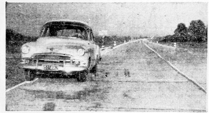
Avtocesta Zagreb—Beograd, uspeh naših mladinskih brigad

MESTNO LUTKOVNO GLEDALISČE, Marionete, Levstikov trg (Sentiakobski) Ponedeljek, 11. maja ob 17: P. J. Pešter »Mogotni pristan«. — Zaključena prdstava za osnovno šolo Preska. RADIO SPORED ZA PONEDELJEK Poročila: 5.30, 6.30, 12.30, 15.00, 17.00, 19.30 in 22.00. 12.00 Opoldanski koncert. 12.45 Pešter »Mogotni pristan«. 13.00 Simfonija, 15.30 Simfonija, 17.00 Simfonija, 18.00 Simfonija, 19.00 Simfonija, 20.00 Simfonija, 21.00 Simfonija, 22.00 Simfonija.