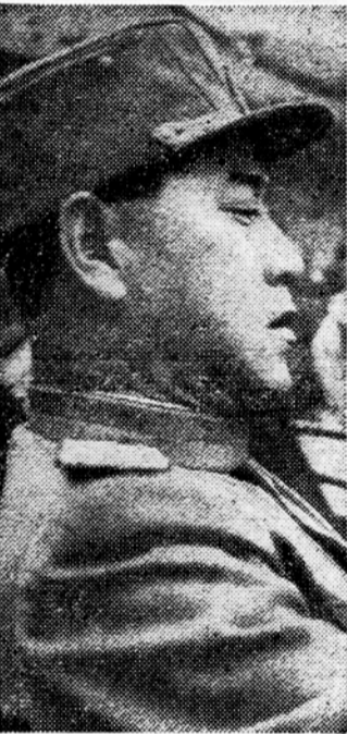
Severnokorejski general Nam Il